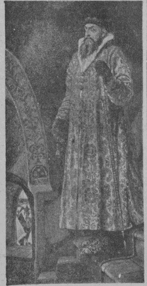
ЦАРЬ ИВАН ВАСИЛЬЕВИЧ ГРОЗНЫЙ