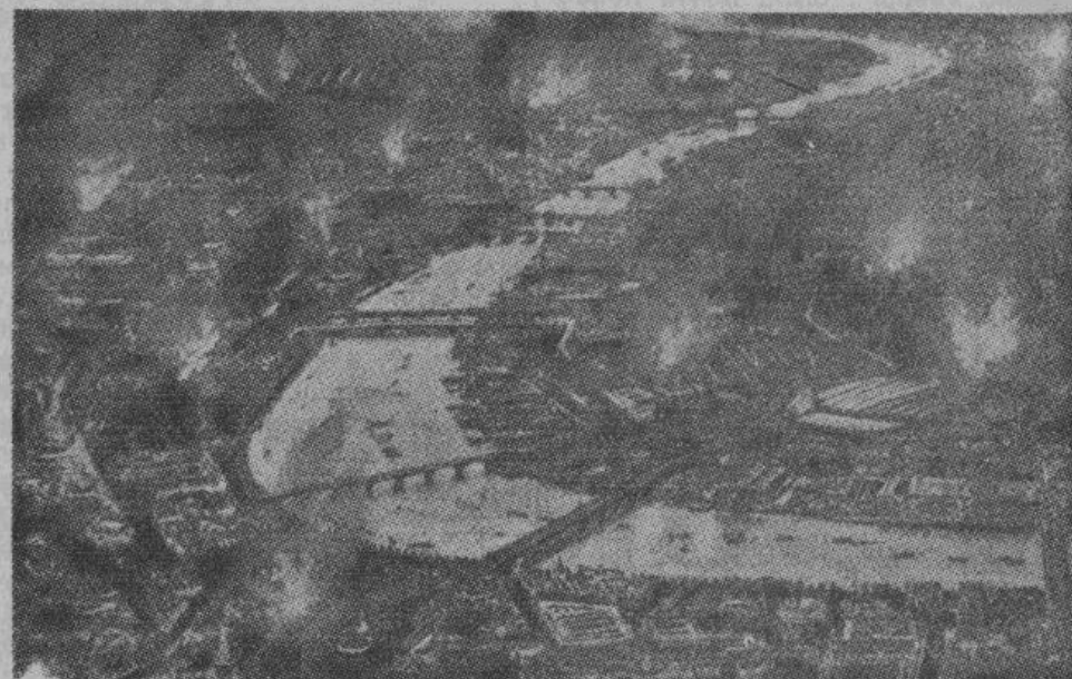
Лондон во время очередного германского налета.

же, что число налетавших немецких самолетов, было значительно больше, чем в последнее время. Этот налет, в ряду предыдущих, следует считать самым тяжелым.