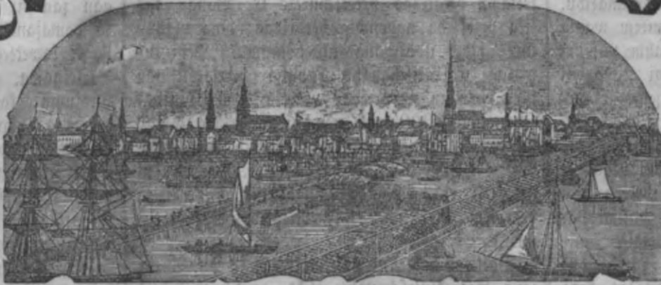
Mahjas Weefis ismahk weenteis pa nedeku.

Maksa beš peesubtitščanas Rīgā: Ar Peelitumu: par gadu 1 r. 75 l. beš Peelituma: par gadu 1 " — " Ar Peelitumu: par 1/2 gadu — " 90 " beš Peelituma: par 1/2 gadu — " 55 "