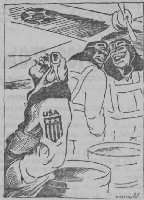
— Подумаешь, — разбомбил церковь, и нос задрал! Я папский дворец в Ватикане разрушил, и ты еще не хвастаешься!...