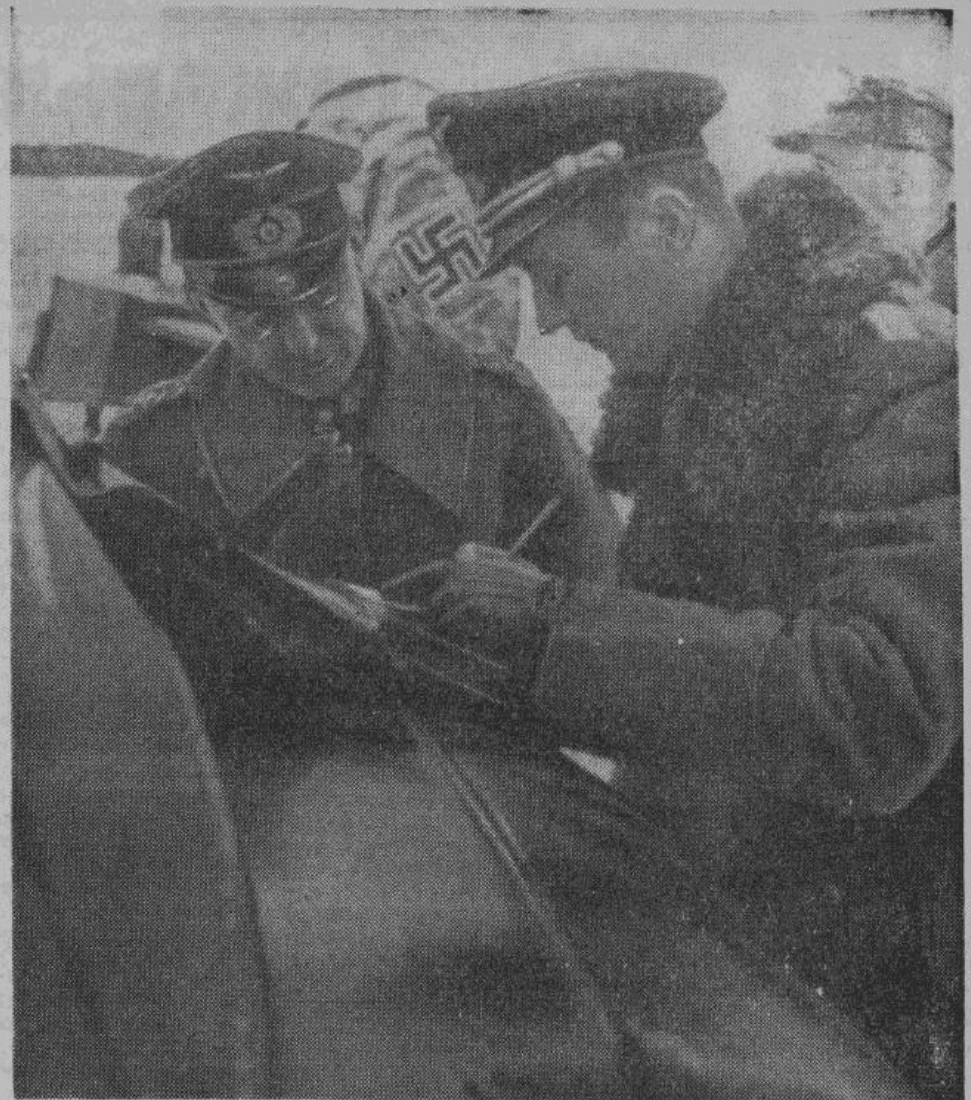
Командующий северным участком восточного фронта генерал-полковник Модель принимает донесение командира истребительной эскадрильи.

Большевизм эволюционирует и сегодня, но это — эволюция к окончательному идейному и политическому банкротству. Дело истинных русских патриотов — не поддаваться маниловским фантазиям о превращении большевизма, а беспощадно разоблачать кровавые палачей, превращающихся в размазанных фигляров, выступающих под предводительством массового убийцы в мундире верховного маршала.