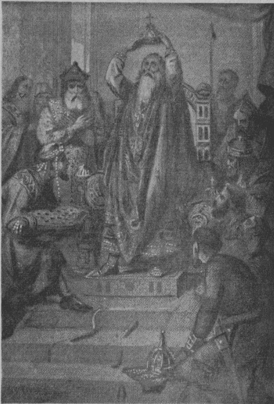
КОРОНАЦИЯ ВЛАДИМИРА МОНОМАХА

ред лицом епископов, игуменов, дружины и городских людей, «чтобы нам можно было сообща оборонять Русскую Землю от поганых». Но Олег высокомерно ответил: «Не годится мне итти на суд к епископам и смердам». Летописец сурово укоряет Олега за смысл буйный и слова величавые. Но Олег не ограничился величавыми словами: он явно держал руку поганых. Мономах вынужден был начать с ним войну. В этой войне Олегу удалось один только раз одержать победу, в этом бою был убит шестнадцатилетний Изяслав, сын Мономаха и крестник Олега, а жена убитого была захвачена Олегом. Скоро он потерял все свои города. Но победитель Мономах не искал его гибели, он обратился к Олегу с предложением мира и обещанием возвратить ему Чернигов. Мономах написал Олегу удивительное письмо, полное печали, кротости и великодушия. Он писал: «Когда убили дитя мое и твое перед тобою, когда ты увидел кровь его и тело увянувшее, как цветок, только что распустившийся, подумать бы тебе, стоя над ним: «Увы мне, что я сделал, для неправды света сего взял грех на душу, отцу и матери причинил слезы. Богу бы тебе тогда покаяться, а ко мне написать грамоту утешную, да сноху прислать, потому что она ни в чем не виновата».