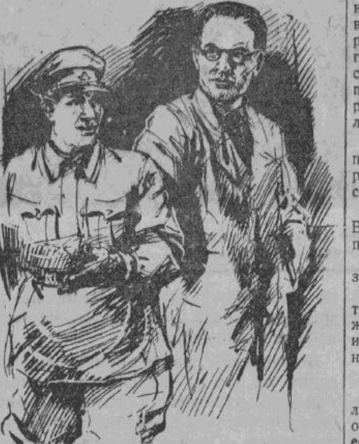
— Подумаешь, — разбомбил церковь, и нос задрал! Я папский дворец в Ватикане разрушил, и ты еще не хвастаешься!...

Самоохраннык встал, пошатываясь. Двое из его товарищей поддерживали его под руки. В глазах у всех трех была волчья злоба.