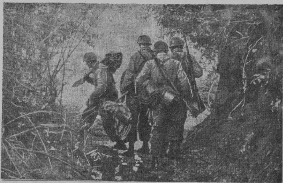
Германские парашютисты в районе Неттунно готовятся к внезапной атаке на англо-американские позиции.

Германские войска перешли в решительную контратаку и после упорного боя отбили у противника развалины замка, находящиеся в северо-западной части города. Неприятельские части, в составе которых сражались преимущественно индусы, новозеландцы и марокканцы, понесли тяжелые потери. Весь город превращен в груды дымящихся развалин. Теперь англо-американцы, с помощью ураганного артиллерийского огня и массового применения тяжелых бомбардировщиков, снова пытаются продвинуться вперед. Четвертое сражение за Кассино в полном разгаре.