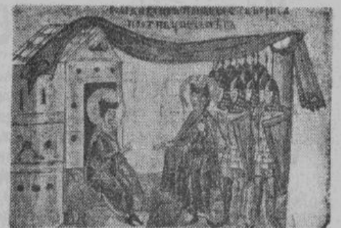
КНЯЗЬ С ДРУЖИНОЙ (старинная миниатюра)