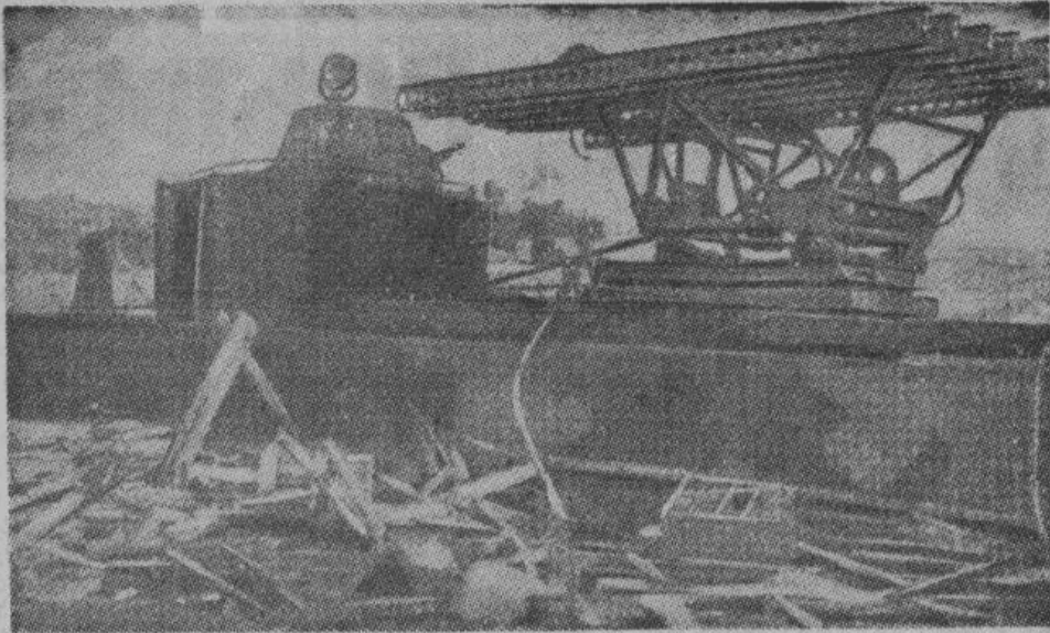
Германские и румынские войска в упорных боях разгромили советский десантный плацдарм у Керчи. На снимке — советское залповое орудие, установленное на канонерке, захваченной немцами