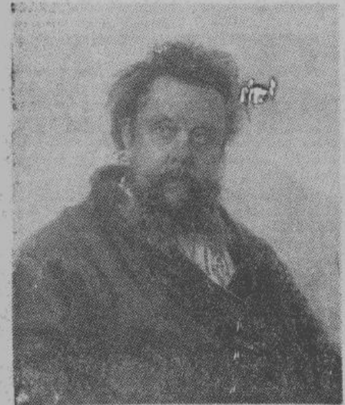
М. П. Мусоргский — И. Е. Репина

Так писал Мусоргский 2 (14) февраля 1837 года Стасову, накануне первого исполнения на сцене Мариинского театра в Петербурге трех сцен из его «Бориса Годунова». И действительно, какой грязи ни лили на композитора, как ни издевались над его