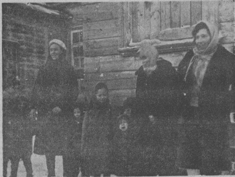
У нового жилища

В результате первой огромной волны беженцев 1919-20 годов и последовавшего затем медленного, но бес-