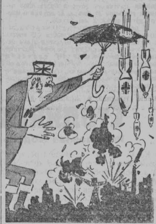
— Мы, ведь, бомбардируем только жилые дома, а они портовые сооружения. Я так не играю!