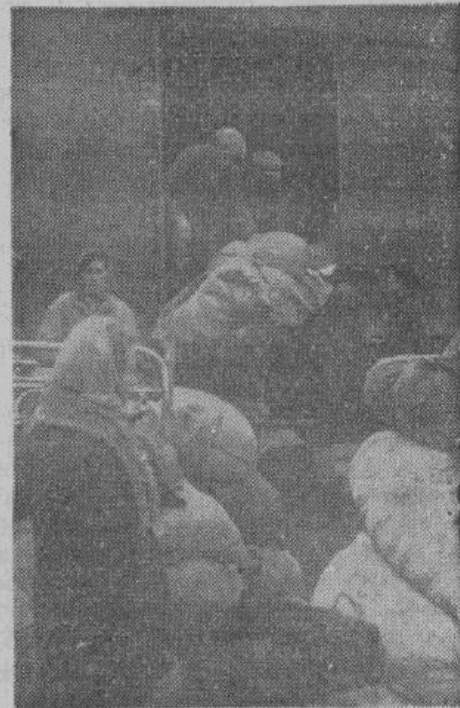
На новые места