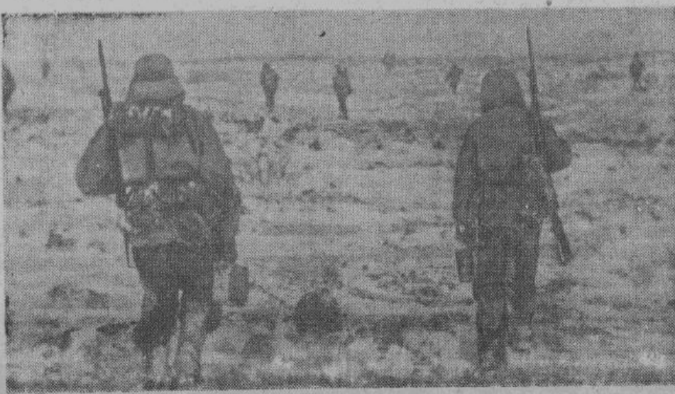
Юго-восточнее Витебска немецкие гранатеры переходят в контратаку, чтобы ликвидировать неприятельское вклинение

В день Красной армии Сталин, улыбаясь притворной улыбкой, подошел к какому-то вышколенному и выдрес-