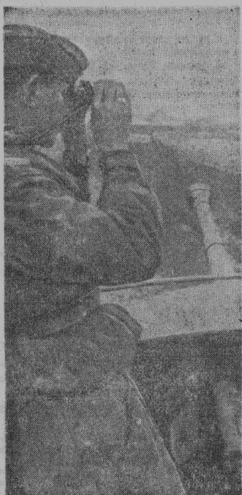
Командир германского самоходного противотанкового орудия внимательно следит, — не появится ли на горизонте неприятельский танк.

В осведомленных кругах полагают, что американская авиация в этот день потеряла, по меньшей мере, пятьсот человек летного состава.