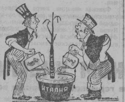
Сами садили мы садили, самим нужно поливать! До сих пор нас только бьют, — Будем счастья поджидать.