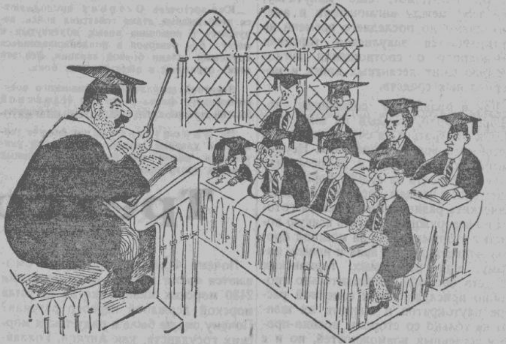
Изучение «Краткого курса истории ВКП(б)» в Оксфордском университете (Англия).