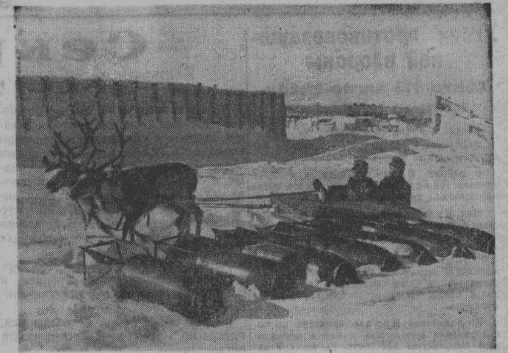
За полярным кругом. Германские горные стрелки, сражающиеся у Северного Ледовитого океана, едут навстречу своим товарищам-летчикам

Тем не менее, германские солдаты продолжали неравную борьбу в развалинах совершенно разрушенного огнем неприятельской артиллерии города. Все уже становилось пространством, обороняемое остатками тарнопольского гарнизона. Все чаще случалось, что из-за недостатка сил гарнизона города не мог ликвидировать то или иное вклинение противника. 9-го апреля, после четырехчасового ураганного огня противника, германские войска принуждены были уступить наступающим со всех сторон советским танкам восточную часть Тарнополя. Однако, к утру уже был готов