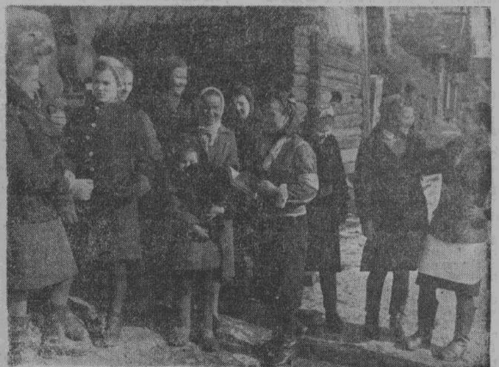
В свободное от работы время санитарки собираются на деревенской улице. (К статье «В походном лазарете»)