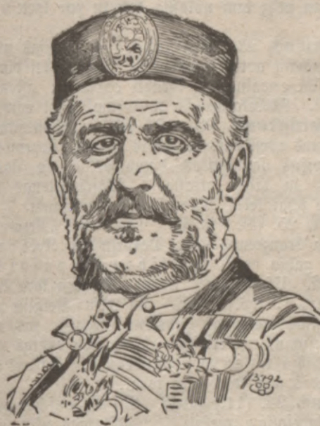
Mikhalowes knajs Mikolajs I.

Tuwajos austrumos — Turzijā 23. (10.) julijā swi-neja konstituzijas otro gada deenu, jo pagahjuschi, luhl, jau diwi gadi, kamehr Turzijā eewesta konstituzija. Wezā reschima peekriteji nesen bija sarihktojuschy plaschu safweh-restibu pret konstituziju waj jaunturkeem. Bet safwehrestibu atklahja un ismellefchanu schai leetā wehl arween turpina. Safwehrestibas noluhls ihsti bijis tas, gahst jaunturku waldibu un nonahwet partiju wadonus. Pee safwehrestibas peederejuschi neween wezā reschima peekriteji, dauds atlaisti eerehdni, bet ari daudsi oposizijas partijas deputati. Runā