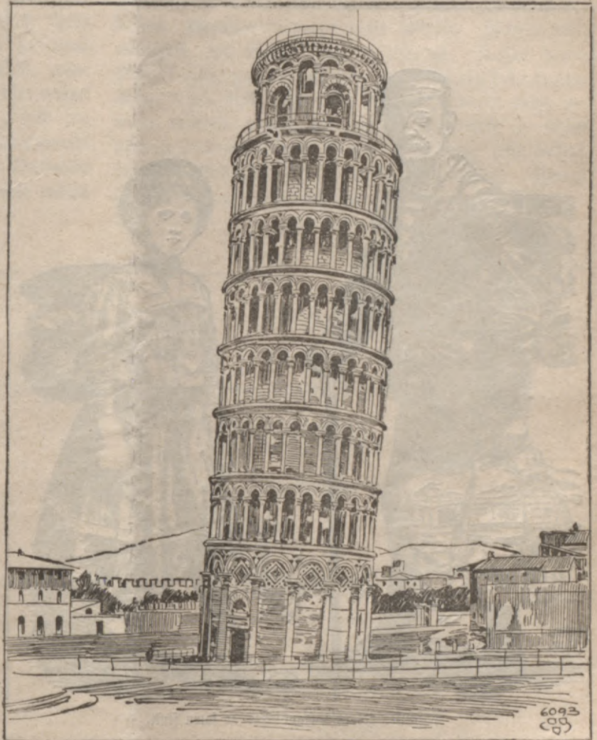
Schlihbais tornis Pija.

Un tad winsch dewas pats atmenam klast, pazehla to klehpi, isnesa no sehtas stuhra pagalmā uu eemeta atpakal wezaja bedre. Bet atmens bija tahds, ka feschcheem peetika to nest. — Schis darbs wifa Wermija tika wehl ilgi stahstits un apbrihnots.