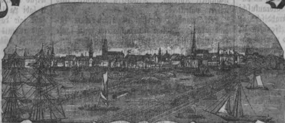
Mahjas Weefis isnahk weenreis pa nedelu.

Maksa ar peesuhstischanu par pasi: Ar Weelikumu: par gadu 2 r. 35 l. bes Weelikuma: par gadu 1 " 60 Ar Weelikumu: par 1/2 gadu 1 " 25 bes Weelikuma: par 1/2 gadu " 85 Maksa bes peesuhstischanas Riga: Ar Weelikumu: par gadu 1 r. 75 l. bes Weelikuma: par gadu 1 " — Ar Weelikumu: par 1/2 gadu " 90 bes Weelikuma: par 1/2 gadu " 55