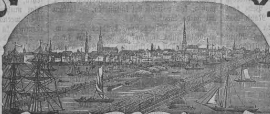
Mahjas Weefis isnahk weentreis pa nedetu.

Ar pašcha wifuschebliga augsta Keisara wehleshanu.