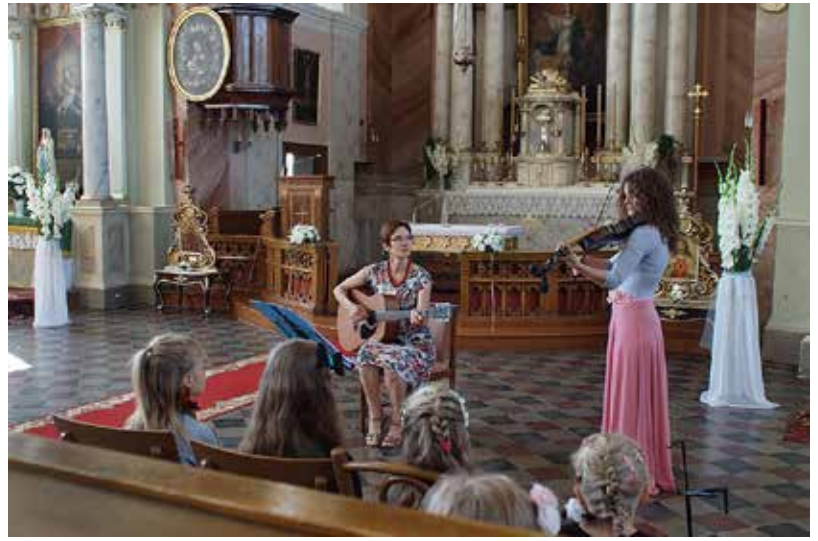
Lielu un svētīgu darbu paveikti Bebrene Svētā Jāņa Kristītāja Romas katoļu baznīcā, kurai nosvinēti 220 gadi. Lielākais prieks - Ziemassvētkos cilvēki varēja ienākt siltā dievnamā, jo beidzot te ierīkota apkure