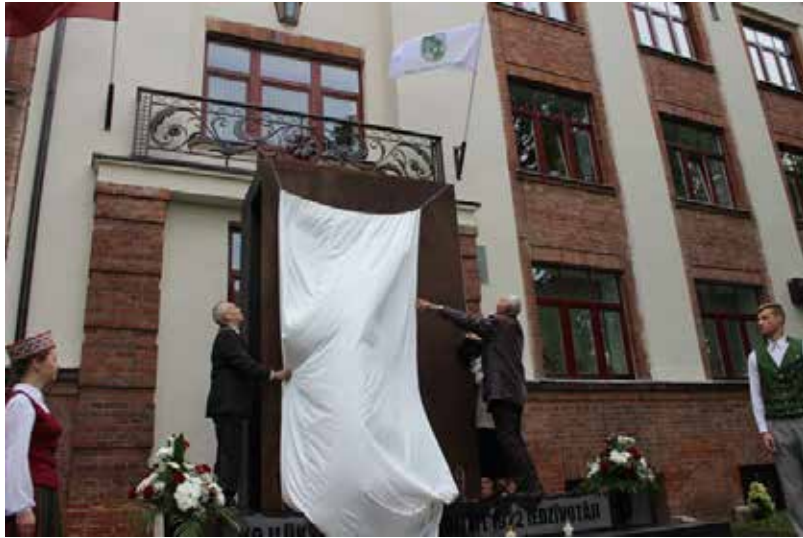
Ilūkstē tika atklāts piemineklis 1941. un 1949. gada represijas cietušajiem

Aizvadītajā gadā tika sakopta arī Šēderes pagasta administratīvā teritorija, it sevišķi Šēderes, Pašulienes, Raudas ciemati. Šēderes un Pašulienes ciemā tika veikta ielu apgaismojuma rekonstrukcija. Šēderes bērnu laukumā “Pasaka” veikts remonts (šūpoles, mājiņas, kapnes), atjaunotas atkritumu urnas. Šēderes ciema sporta laukumā atjaunoti futbola vārti un basketbola grozs. Atjaunoti paziņojuma stendi Šēderē, Pašulienē un uzstādīts jauns paziņojuma stends Grendzes katoļu kapos. Smelines katoļu kapos izcirsti astoņi bīstamie koki. Sakopti astoņi vācu kapi.