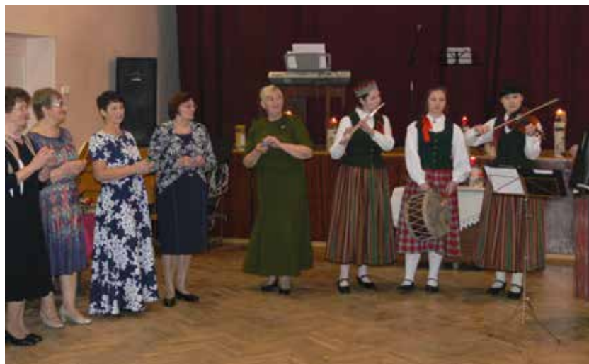
Biedrības “Dvietes vīnogas” organizētajā “Zvaigznes dienas” pasākumā tika degtas zvaigznes par mājām un ļaudīm, kuru laimīgā zeme ir Dviete

Katrai mājai ir savs starojums, aura varbūt. Dažai mājai šis starojums ir tik mazs – tepat ap logu, tepat ap durvīm. No citām mājām tas plūst pāri žogiem, cauri alejām, vai kilometru tālumā tev pretī.