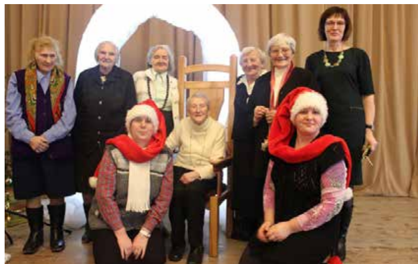
Par pasākuma „Kripatiņa dvēselei” pacilājošo atmosfēru rūpējās Bebrenes vidusskolas biedrība