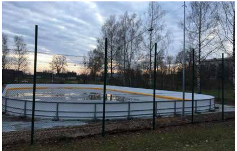
Drīzumā sāks darboties brīvdabas slidotava Ilūkstē

kā arī nosūtīt uz e-pastu dome@ilukste.lv .