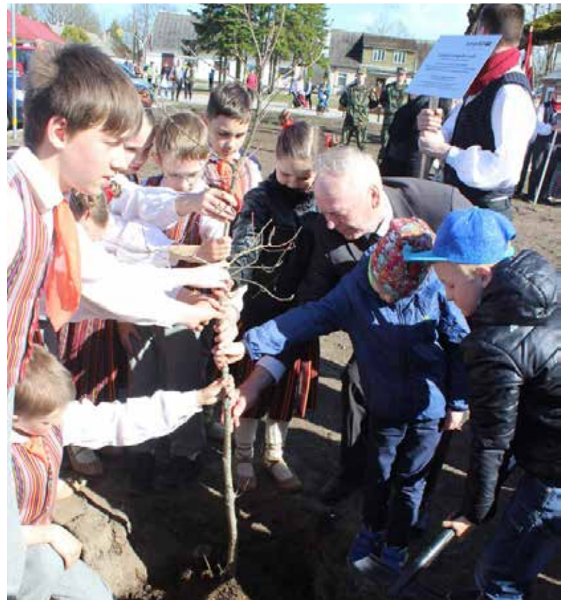
2017. gada skaistākais notikums Subatē – Latvijas simtgades ozola stādīšana atjaunotajā Tirgus laukumā

Arī 2018. gadā mums priekšā tik daudz jaunu iespēju! Vienīgais, ar ko sevi iespējams pierādīt, - ar darbu. Veiksme vienu dienu ir, otru nav, bet panākumi ir atkarīgi tikai no paša cilvēka, no viņa ieguldītā darba, spēka un enerģijas. Nāciet ar savām domām, sapņiem un iniciatīvu! Darbosimies, liksim kopā darbus un darbiņus, lai mūsu dzīve kļūtu skaistāka un labāka! Lai mums nepietrūkst sapņu, ko piepildīt, mērķu, uz kuriem tiekties, darbu, kas dod gandarījumu!