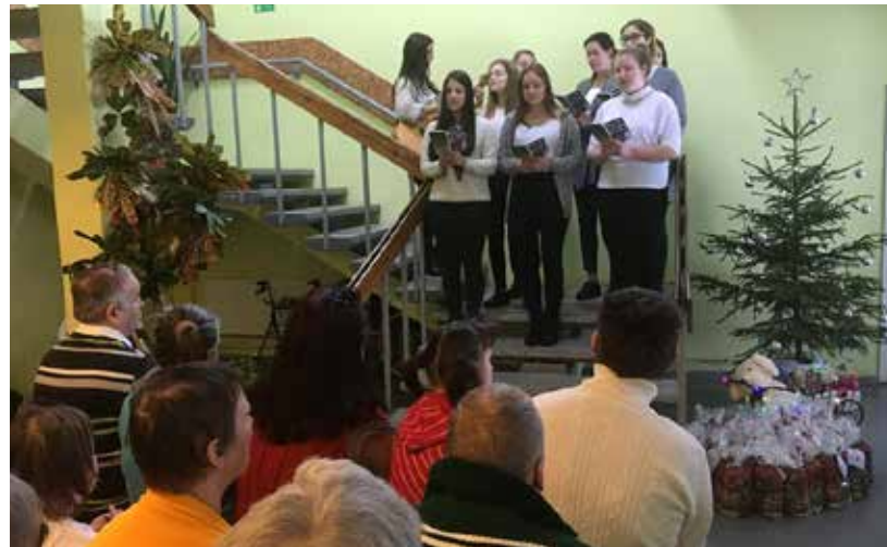
Lai ar skanīgām svētku dziesmām dāvātu prieka dzirksti, Ilūkstes novada jaunieši kopā ar Ilūkstes pašvaldības sociālo dienestu devās uz novada aprūpes centriem

Lai ikkatrs sajūt došanas, dāvēšanas prieku, nesot dzirksti, ko izstaro arī mazas lietas, kāds smaids, dziesma vai pārmīts vārds.