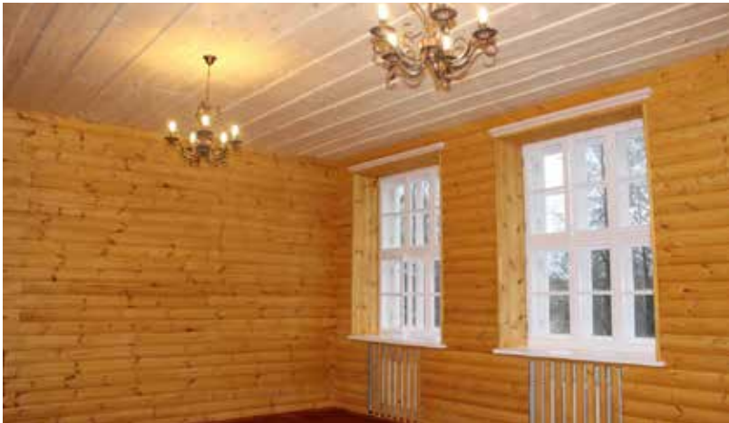
Pašvaldībai īstenojot projektu, Eglaines pamatskolā top jauns tūrisma objekts - “Stendera laika klases”