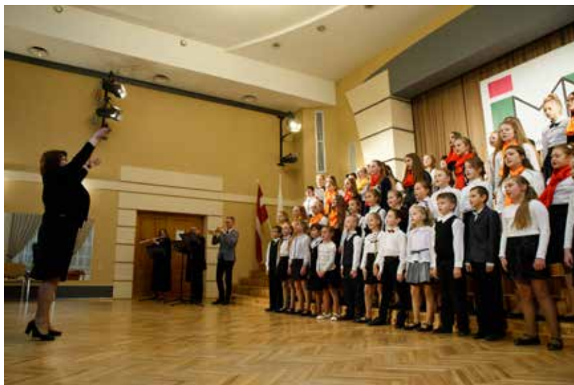
2017.gada 9.decembrī tika svinēta Ilūkstes Mūzikas un mākslas skolas 55 gadu jubileja

“Koku pazīst pēc augļiem, cilvēku - pēc viņa darbiem.” To vēsta latviešu tautas gudrība. Auglīgā augsne koks dzen stipras saknes un briedi-