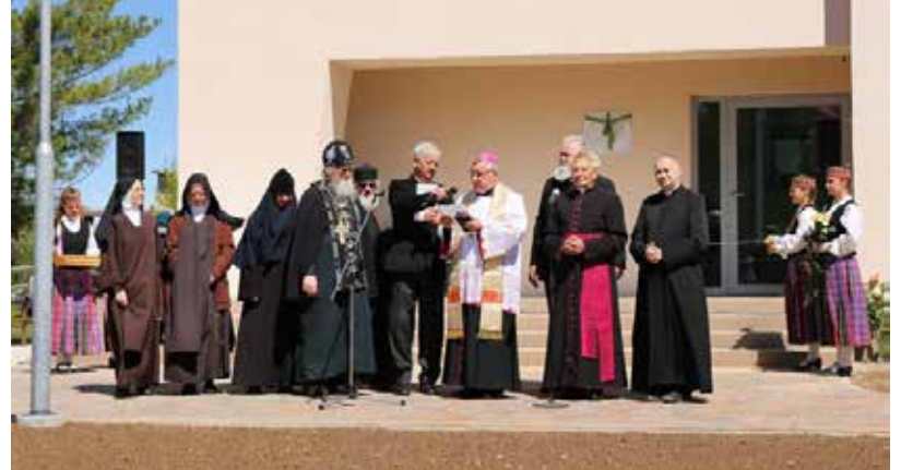
Dvietē svinīgi atklājām pansiju “Mūsmājas “Dižkoks””

2017.gads Dvietes pagastā ir bijis ļoti darbīgs, nozīmīgiem un vērienīgiem notikumiem un pasākumiem bagāts. Dvietes pagasta iedzīvotāji gada pirmajā pusē varēja vērot lielu rosību bijušās Dvietes pamatskolas teritorijā. Pateicoties Ilūkstes novada pašvaldības vadības iniciatīvai un neatlaidībai, tika veikti nopietni celtniecības darbi Dvietes pamatskolas ēkas saglabāšanai un pārbūvei par pansiju „Mūsmājas „Dižkoks””, kā arī veikta teritorijas labiekārtošana – uzstādīti soliņi, āra gaismas ķermeņi, atkritumu tvertnes; izveidotas košumkrūmu un puķu dobes, izbūvēti bruģēti celiņi. Dvietes pamatskolas pārbūve par pansiju, noliedzami, Dvietē ir svarīgākais un lielākais 2017.gada notikums.