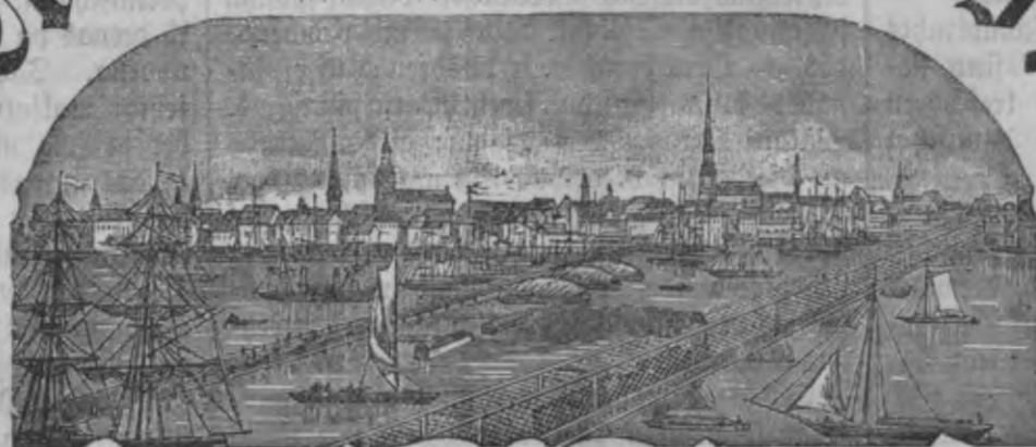
Mahjas Weefis isuahk weureis pa nedetu.

Makfa ar peesuhstifšanu par patti: Ar Peelitumu: par gadu 2 r. 35 l. beļ Peelituma: par gadu 1 " 60 " Ar Peelitumu: par 1/2 gadu 1 " 25 " beļ Peelituma: par 1/2 gadu — " 85 "