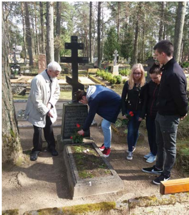
Pie pareizticīgo mecenāta Jegora Kitova (1828–1916) kapa

Mūsu projektā bija paredzēts apmeklēt vienu no Latvijas dievnamiem. Tika izvēlēta Zilupes Kristus Krusta pacelšanas baznīca, kura pēc postošā ugunsgrēka ir uzcelta pilnīgi no jauna. Jaunā baznīca lepojas ar ārkārtīgi skaistiem gleznojumiem uz griestiem