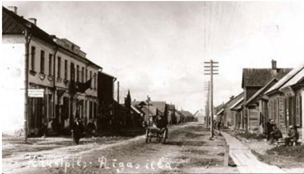
Rīgas iela. Krustpils. 20. gs. 20. gadi