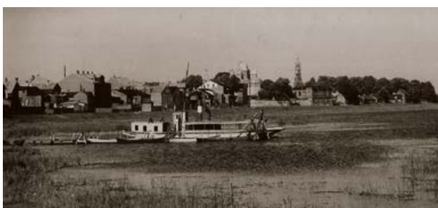
Daugava pie Jēkabpils. 20. gs. 20. gadi. Priekšplānā kuģis „Gulbis”