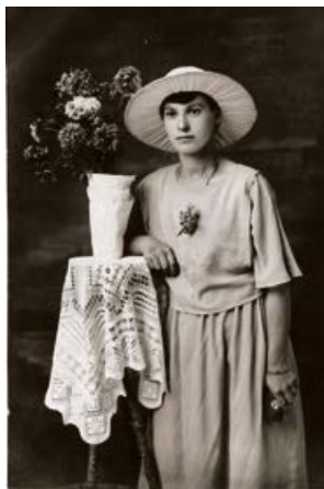
Jēkabpiliete. 1923. gads