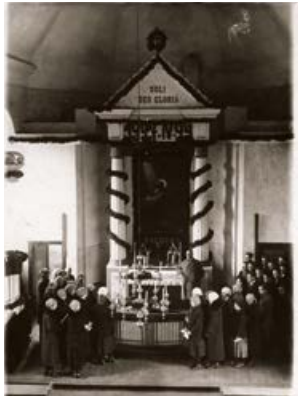
Jēkabpils ev. lut. baznīca. 1927. gada 24. aprīlis