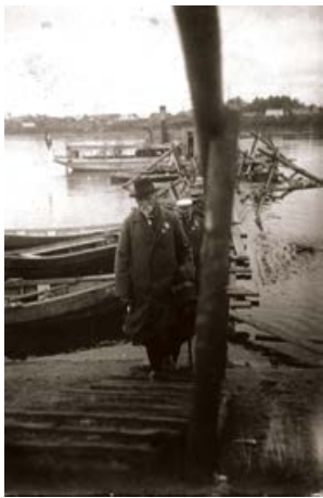
1927. gada 5.-6.jūnijā notiek Krustpils - Jēkabpils Dziesmu un jaunatnes svētki. Ierodas Rainis