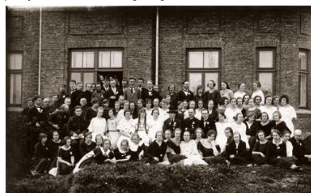
Jēkabpils Izglītības biedrības koris un Jēkabpils Valsts vidusskolas koris Jēkabpili Baltās puķes dienā. 1925. gada 10. maijā