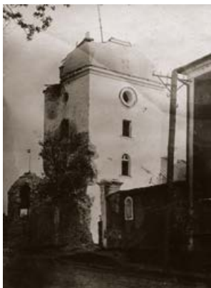
Krustpils pils. Pēc I pasaules kara