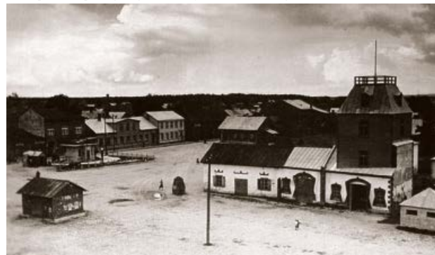
Jēkabpils Brīvprātīgo ugunsdzēsēju depo. 20. gs. 20. gadi