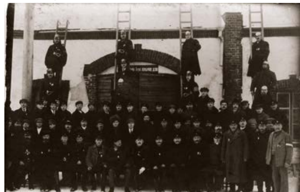
Jēkabpils brīvprātīgo ugunsdzēsēju biedrība. 20. gs. sākums