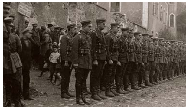
Latgales artilērijas pulka karavīri ierindā pie Krustpils pils. 20. gs. 20. gadi