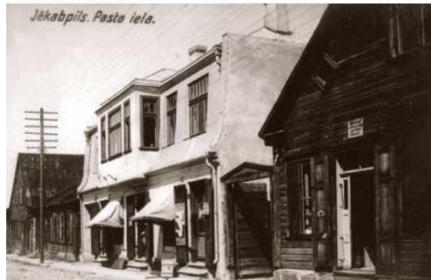
Pasta iela Jēkabpilī. 20. gs. 20. gadi