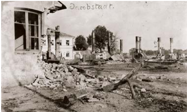
Jēkabpils pēc I pasaules kara. Brīvības iela