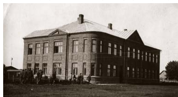
Jēkabpils Valsts vidusskola. 20. gs. 20. gadi