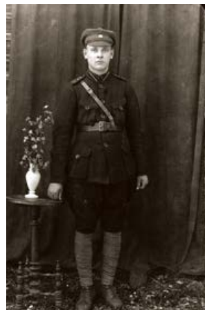
Jēkabpiliētis. 1923. gads