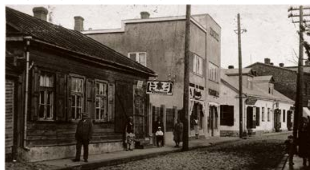
Brīvības iela, Jēkabpils. 20. gs. 20. gadi