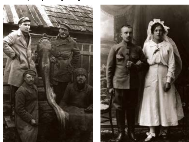
Krustpils plostnieki ar noķerto samu, Krasta ielā. 20. gs. 20. gadi