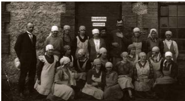
Brāļu Lesu tvaika dzirnavu un lina apstrādāšanas uzņēmuma darbinieki. 20. gs. 20. gadi