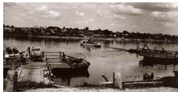
Pārvietošanās līdzekļi pār Daugavu starp Jēkabpili un Krustpili. 20. gs. 20. gadi.