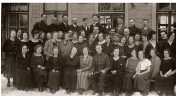
Jēkabpils Izglītības biedrības koris. 1925. gads