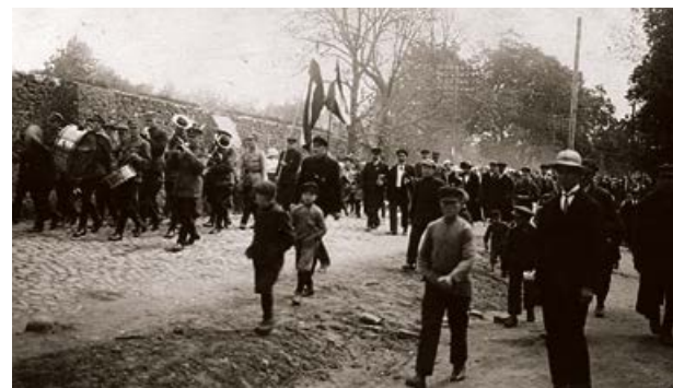
Gājiens pa Rīgas ielu. 20. gs. 20. gadi