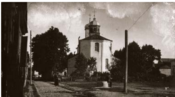
Jēkabpils Visvētās Dievmātes Pokrova draudzes dievnama (Uniātu) kopskats no Katoļu un Pasta ielas krustojuma. 20. gs. 20. gadi