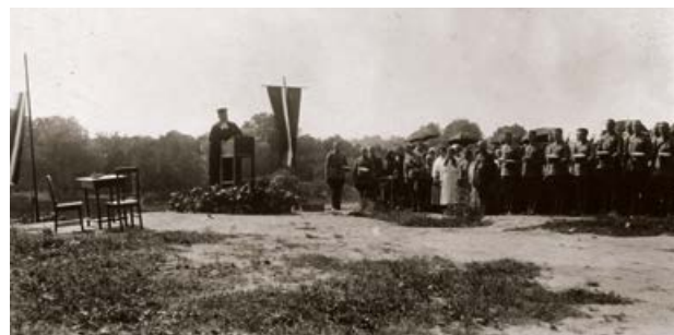
1925. gada 26. jūlijā Rīgas ielā tiek ielikts pieminekļa „Kritušiem par Tēviju 1918–1920” pamatakmens

Vēstule sūtīta no Krustpils uz Sunākstes pagastu Mērijai. Vēstulē saglabāta oriģinālā rakstība.