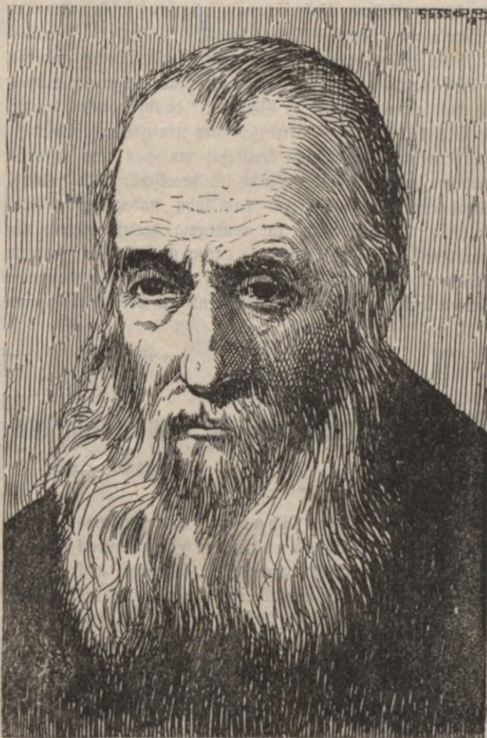
Melancholitis. Jaunatrasa Rembrandta glezna.