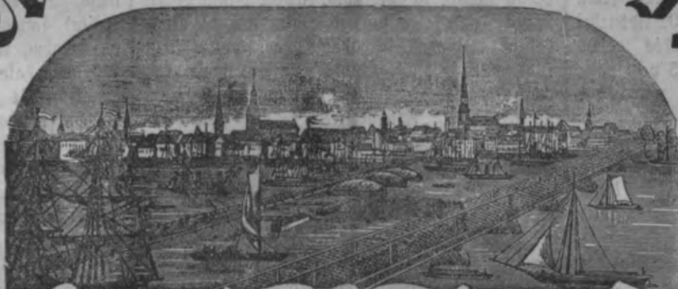
Mahjas Weefis isnahk weentreis pa nedetu.

Ar pašas wifuskehliņa augsta Keisara wehleshanu.