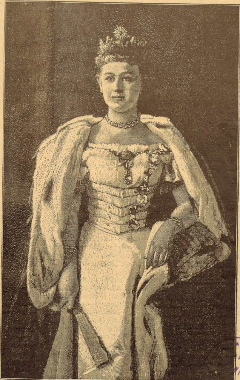
Holandijas karaleene Wilhelmine.

Bluntſchli teiza, ka apſinas brihwiba naw juridifſs jehdſeens, kam wajadſiga teeſſka aiſſtahwiba, lihdſigi winam ſpreeda ari ziti walſis ſinatnu prateji. Pat Peteris leelais iſteizas: „Deews dewa keiſareem waru pahr tautam, bet pahr kauſchu apſina wara tikai Kriſtum ween.“ Lai peenahſt proletariata diſtaturas laiks (balſs pa kreift: peenahſs ar!), waj tadeht es wais netizefchu? Suhſ ſinat, ka kaudis par ſawu pahrleezibu mira zeetumos un uf ſahr-