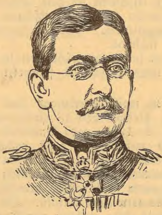
Generalis fon der Goltz.

Meers Turzija wehl naw eestahjees. Ruhgšt wehl waj wifās walstis datās. Ari kahršchanas turpinās. Tā 28. majā (10. junijā) kara teefa noteefaja us nahwi feshus armenus un dewiaus turkus, kuri peedaltjufshees Adanas flaktiāos. Sultans spēedumu apstiprinajis. — Turku awises raksta, ka sultans esot loti faruhgtinats par to, ka arabi, fīreeschi, kurdi un albani pret wiau isturotees tīk neustizigi. Kristigee isturotees ar leelaku ustizibu nekā wina tizibas brahiti un tas winam gaušchi fahpot. Ka neustiziba pret sultanu ir leela, tas teefa. Tā Libanonas waljis (gubernators) peeprašjis, lai wisdrihsakā laika winam suhtot kara spēhku, jo pretefā gadījumā winafch neustemotees atbildibu par kahrtibas ušturefchanu, tāpat ari Adanas nemeeru ismeleschanas komiſija peeprašjufe pehz papildu spēhteem, jo tā newarot dotees us semeš wideeni tadeht, ka us katra sofa teefot apdraudeta un eedfihwotaji tai pretojotees. Kurdi turpretim atkal no fawas pufes atklahti pašnojufchi komiſijai, ka, ja Adanas apgabala wideenā us nahwi noteefaschot kaut jel weenu weenigu mohamedani, tad wini farihtofschot tahdu ašns isleefchanu, ka nodrebeschot un fatrizinaschotees wif walstis pamati. Weenigi mainigi esot pašchi armeni, kuzus tad ari warot kahrt zif ween