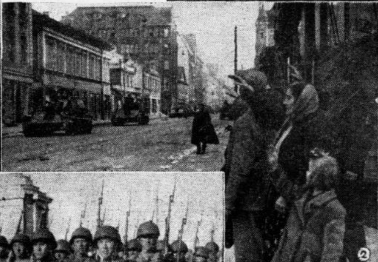
1. Tā fašistiskais nezvērs postīja mūsu galvaspilsētu.

korpusa ārējās durvis, Vitols lēniem soļiem aizgāja pāri sētai uz savu būdu. Nakts gulēja apkārt kā melns, nekustīgs ūdens. Kaut kur tālā dziļumā skāpeja šāvieni, rēca sirēnas. Viņš atlaidās uz sola un vaļējām acīm sēdēja līdz rīta gaismai.