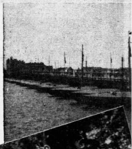
2. Sajūsmā rīdzinieki sveica saulaino 1944. g. 13. oktobra rīta ausmu. 3., 4. Latvju gvardi iesoļo Rīgā. 5., 6. Jaunās dzīves vārtos.

«Ko tu te dari?» Viens plēgrūda sargam pie krūtim. «Sargāju fabriku.» Vitols atbildēja, pussoli atkāpdamies. «Nu, nenosargās!» tas iesmējās. «Sargies tikai, ka cepuri