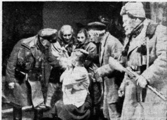
Aina no Viļa Lāča lugas «Vedekla».

Sodien Sarkanās Armijas kara pulki jau cinās ienaidnieka zemē un laužot nocietinājumu sprostus, tuvojas pašai zvērnīcai — Berlīnei. Piepildās tas, ko alkst visa progresīvā cilvēce, ko alkstam mēs ikviens kopā ar rakstnieku. Tuvojas atmaksas stunda. E. Damburs