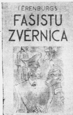
VAPP Dailliteratūras apgāda izdevums Rīgā 1945.

Ja par padomju rakstnieku saka, ka spalva viņa rokā ir šautene vērstā pret ienaidnieku, tad visticšāk tas attiecināms uz Ilju Erenburgu.