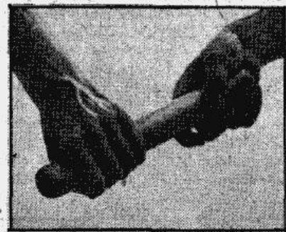
Frankfortes maiņa: no kreisās rokas kociņš tiek nodots diagonāli labā rokā.

Pirms apm. 10 gadiem Vācijā vēsturiskas un sīvas cīņas 4x100 m maiņas sacensībā izturēja 3 biedrības: Berlīnes — Šarlottenburgas SK, Preusenes — Krefeld un Frankfortes — Eintracht. Kaut arī vienību sastāvos bija tikai reti „zvaigznes“, viņi savstarpēji konkurencē Vācijas rekordu „nodzina“ zem 42,0 sekundēm. Tas nepārprotami pierādīja, ka noslēpota maiņas tehnika, labi trenēta stafetes zīmes pārdošana var dot ne tikai laika ietaupījumu, bet vēl vairāk spēj vājāku skrējiena izlīdzināt. Toreiz visas vācu vienības kociņu nododot lietoja vienu papēmienu: stafetes nodevējs padeva ķermeņa augšējo daļu uz priekšu, cik vien iespējams tālu izstiepa roku ar maiņas kociņu. Stafetes saņēmējs savkārt izstiepa roku, mazliet padodams arī plecu atpakaļ. Tā radās apm. 2 m plata stafetes pārdošanas joslā, kura skrējējiem it kā nemaz nebija jāveic. Šis manevrs aiztaupīja mazākas trīs desmitdaļas sekundes un 3 šādi momenti (3 maiņas) deva veselu „sekundes“ pātrinājumu. Skatītāji un pat speciālisti tika ļoti pārsteigti ar šo „telpas izjusto“ maiņu. Tā ka skrējēji izmantojot „telpas izjusto“ maiņu, nesanača cieši kopā, tad pie mazākās nenoteiktības stafetes nodošana varēja neizdoties, sevišķi iespējams tas kļuva tad, kad maiņu izdarīja joti ātrs skrējējs ar vājāku sprinteru. Amerikāņi, kas mazāk uzmanības veltīja tieši maiņas mirklim, toties vairāk pievērsās pašam skrējienam, atrada jaunu, drošāku kociņa nodošanas manevru. Viņu slavenais stafetu vienību treners Harijs Hilmanis ir šī „izgu-