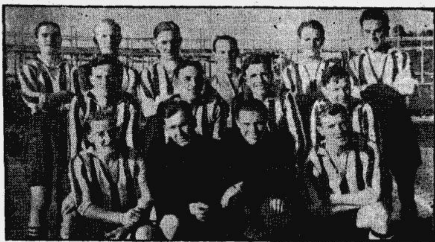
Oslo pilsētas vienība.