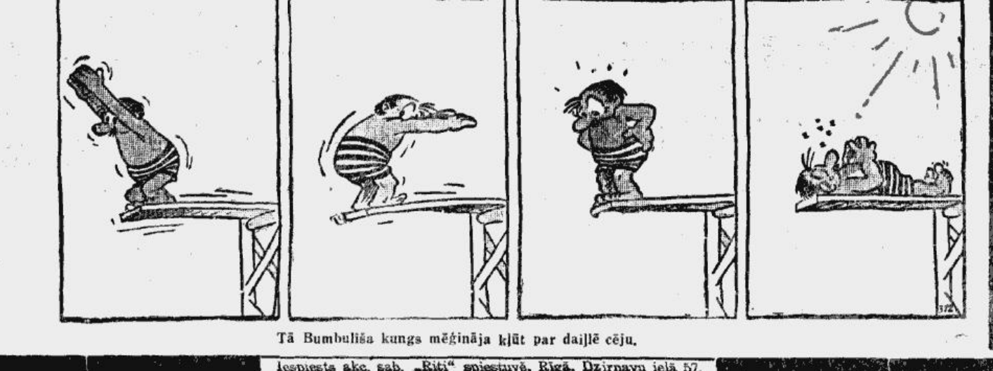
Tā Bumbuliša kungs mēģināja kļūt par daiļlēdžu.

(Speciālizojums „Sporta Pasaulē“) Bernē, 10. jūlijā. Starptautiskās soļošanas sporta savienības rīkotā Eiropas meistarsacīkstes izcīpa 170 km soļojumā ap Ženēvas ezeru devnsi uzvaru franču soļotājam Kornē, kurš veicis visu distanci 18 stundās un 24 minūtēs. Tas ir jaun arekords šai sacensībā. Kornē starplaikos uzstādījis arī jaunus pasaules rekordus 100 un 150 kilometros — 9:35:51 un 15:25:51.