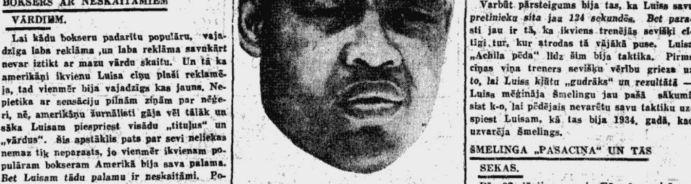
Melnais pasaules meistars.

Augšējā uzņēmumā: Džo Luiss 22. jūnijā cīņas 124. sekundē dod šmelīngam k-o sītienu! cot Luiss taktiku, šita savu pretinieku k-o.