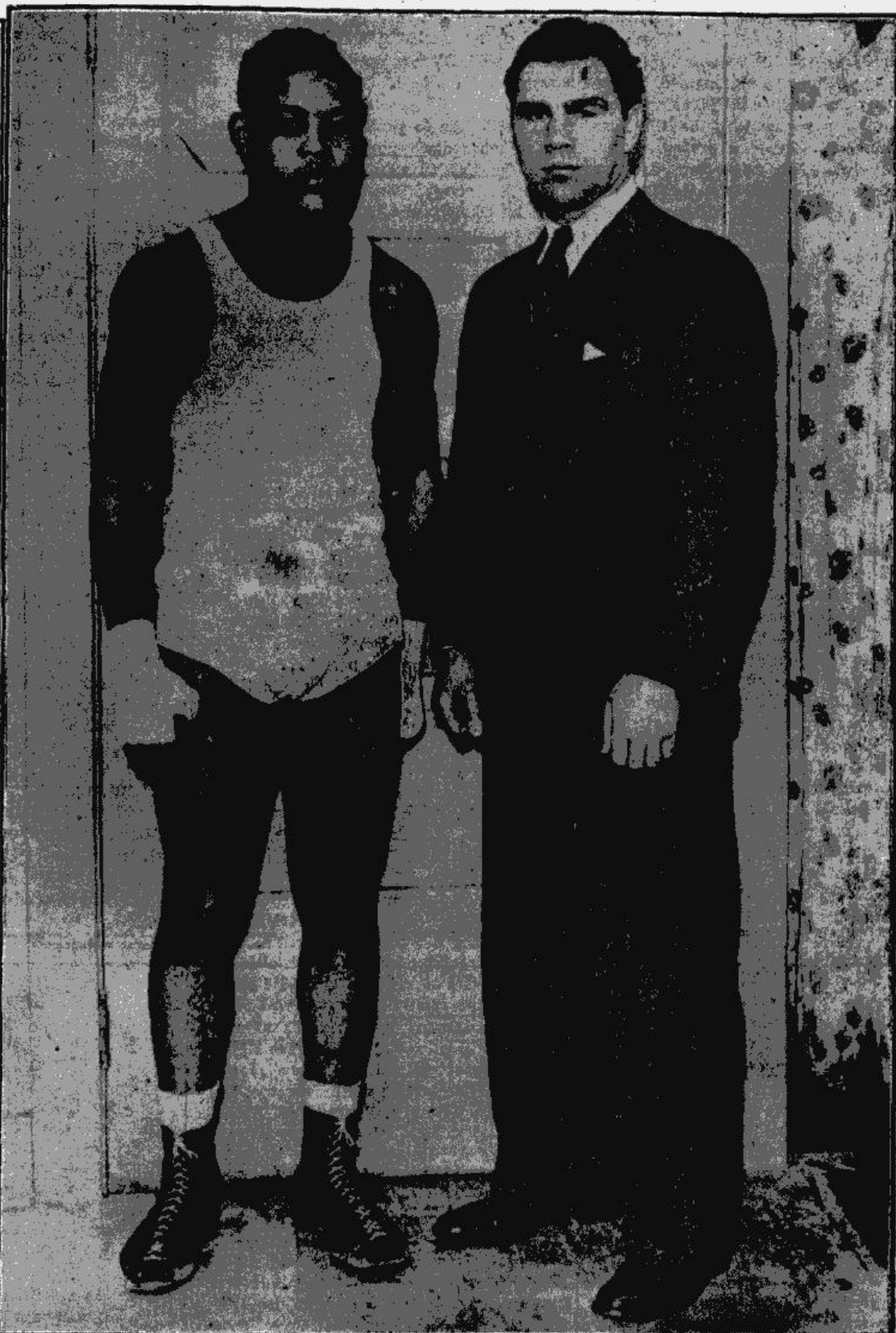
Pa kreisi — Džo Luisa nākošais pretinieks Maksis Bērs. Pa labi — Maksis šmeļņi un Džo Luisa pirmā vēsturiskā 22. jūnija cīņa.

Lielā cīņā ir beigusies. Jozefs Luisa Barrova, jeb Isāki sakot — Džo Luisa, palicis neuzvarēts. Viņš bija tas, kas atņēma šmelņģam izredzes kļūt pirmajam „come-back“ varonim. Šmelņģa sapnis ir izgaiss zem „melnā dinamita“ nežēlīgajiem sitieniem un Luisa paliek pasaules boksa meistars. Šī lielā mikla atvaināta, bet amerikāņi tagad nostādīti jaunās, vēl lielākas miklas priekšā, un proti: kas spēš Luisam atņemt titulu? Vai tas būs kāds baltais vai arī nēģeris? Stāvoklis stipri atgādina laiku, kad Dempsejs, gadiem ilgi neuzvarēts, stāvēja vientuļš savas boksa karjēras augstumos bez nopietnāka pretinieka.