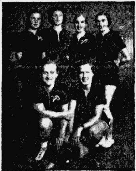
C. JSO sieviešu vienība.

JAUNI AMERIKĀNI RĪGĀ. — SPĒLĒ ARĪ KAUNAS C. JSO SIEVIEŠU VIENĪBA.