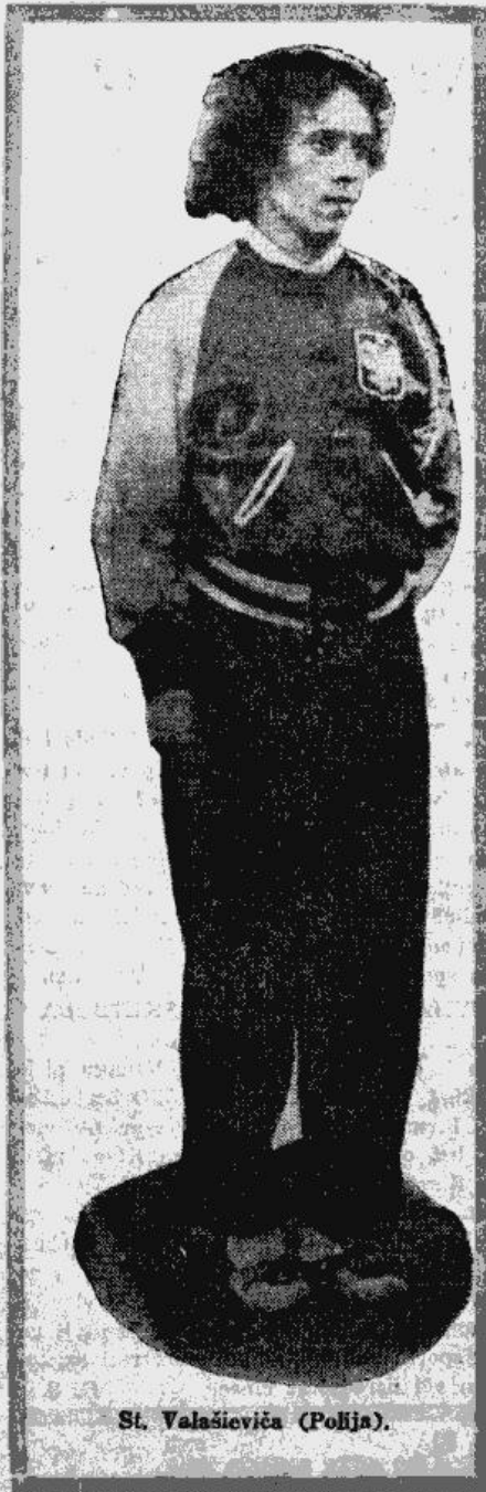
St. Valasieva (Polija)