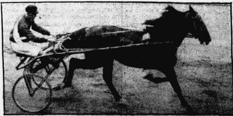
"Pastorkus" - uzvarētājs pag. svētdienas rikšošanas sacīkstēs hipodromā.

Rit. 9. oktobrī. plkst. 12.00 JKS. laukumā