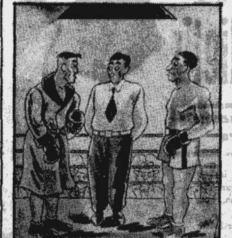
Tiesneša kungs, esiet tik laipni, atļaujiet man cīnīties mētelī, jo esmu mājās aizmirsis bikstēs... .