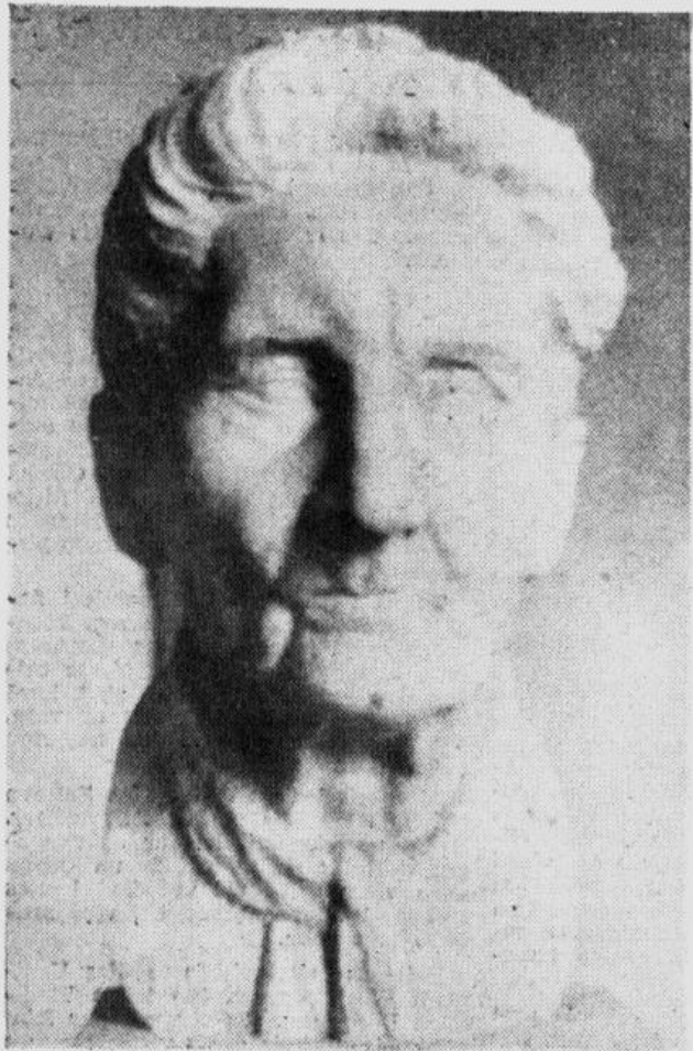
L. S. Grabinska veidots Tautas nākslinieces Ber- tas Rūmnie- ces krūstēls, iz- stādīts Valsts lat- viešu un krievu mākslas muzejā.