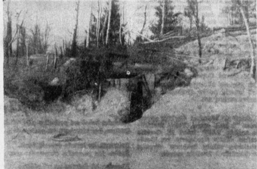
„Latviešu Strēlnieka” redaktora mītne Kurzemes frontē

Sai vietā arī man jāzbeidz stāsts par „Latviešu Strēlnieka” kara gaitām.