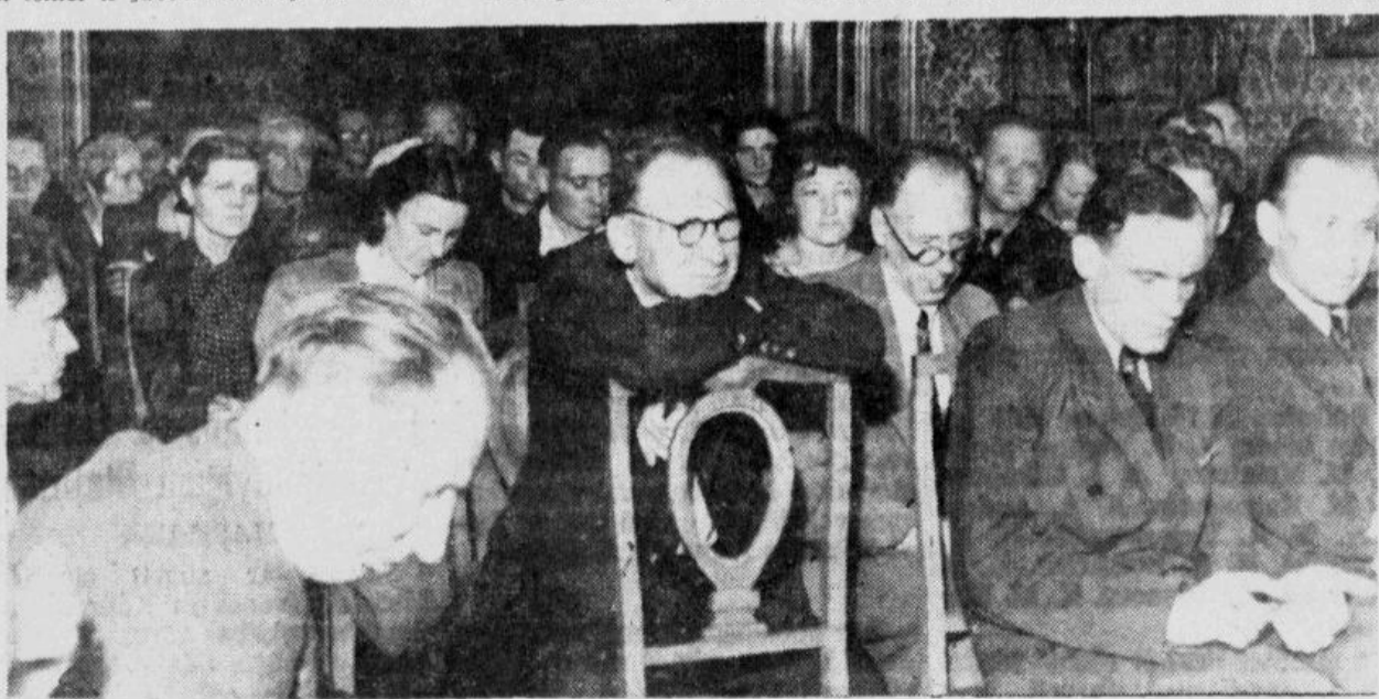
Latviešu padomju rakstnieku darba sanāksmē