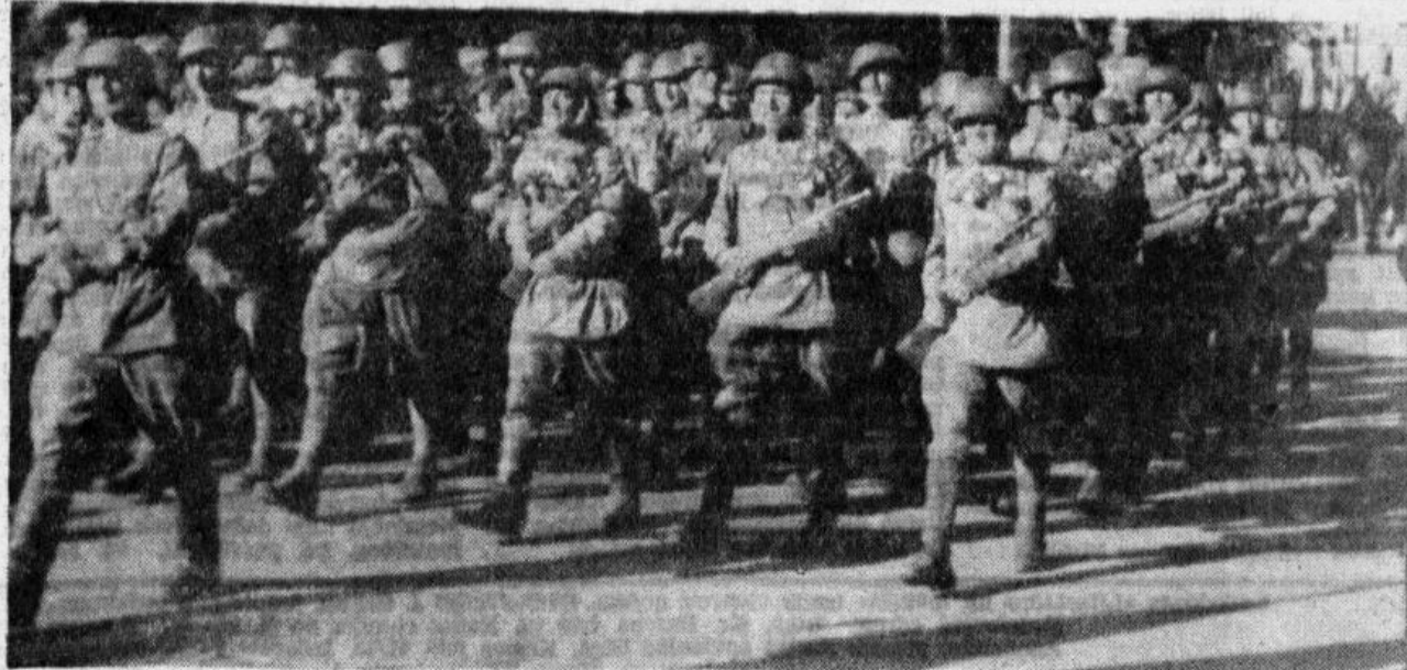
Strēlnieki gvardi atgriežas Rīgā

Es stāstīju par apstākļiem, kādos strādāja „Latviešu Strēlnieka” redakcija. Par to, ko viņa veikusi, lai stāsta kāds cits.