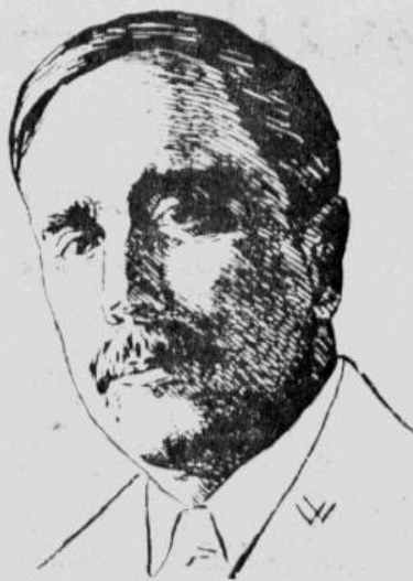
DŽORDŽS HERBERTS VELSS

Nesen visā kulturalā pasaulē pieminēja ievērojamo angļu rakstnieku Džordžu Bernardu Šovu viņa 90. dzimšanas dienā, drīz pēc tam šķīrās no dzīves viņa laika un ideju biedrs, nepilnus 80 gadus vecais Džordžs Herberts Velss. Abi viņi jau jaunībā iesaistījušies sabiedriskās cīņās, ilgodamies labākas nākotnes, nebūdami mierā ar kapitalistisko iekārtu. Fabianisms, kam viņi abi bija sākumā pieķērušies, nelāva Šovam, un Velssam dažkārt nokļūt pie pazīstam slēdzieniem par metodēm un līdzekļiem, ar kādiem jāizcīnā jauna, labāka sabiedriska iekārta, bet viņu dedzība allaž bijusi liela, un progresīvā cilvēce abos viņos pamatoti saskata savus draugus.