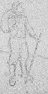
Valsts izdevniecībā drīzumā iznāks M. Andersena-Nekses romāna «Pelle iekarotājs» I daļa «Bērnis». Vāku zīmējis O. Kalējs.