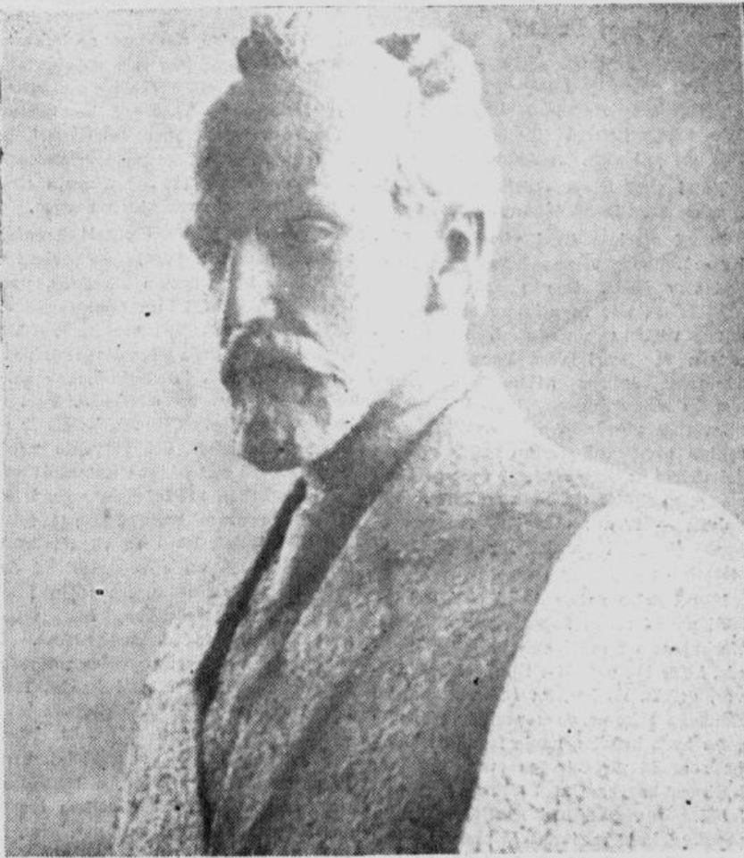
Jauns Raiņa portrets

Padomju teātris ir nostāigājies lielu, skaistu ceļu. Tas ir attīstījies kopā ar tautu un sava darba labākajā daļā atspoguļojis tautas dzīvi, centienus un cīņu. Padomju teātriem ir lieliskas perspektīvas. Partija un valdība sniedz teātriem un teatru darbiniekiem ievērojamu palīdzību. Tāpēc teātriem jāklūst par valsts politisko ideju pāudējiem, godam jāizpilda savs pienākums pret tautu, kā to norāda Lēpina un Staļina partija.