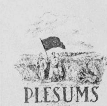
Valsts izdevniecība izlaidusi M. Solochova romāna «Pļesums» pirmo daļu (vāks — S. Geļberga). Drīzumā iznāks Džemsa Oļrīdža «Jūras ērglis» ar J. Plēpja zīmētu vāku.