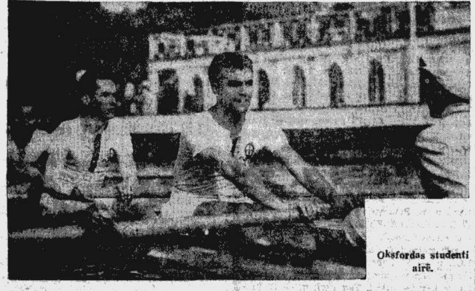
Oksfordas studenti airē.

Tāpēc arī filma ir tik reāla, ka tās notikumi attēloti tieši tur, kur tie notikuši. Par šo filmu jāsaprot, ka šeit redzama „dzīve uz vietas“.