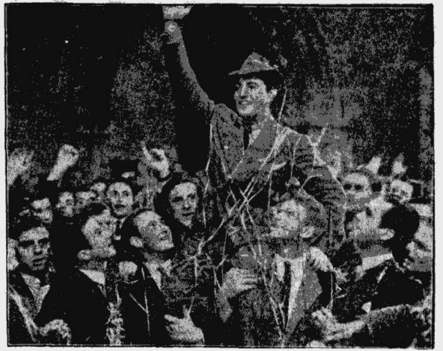
Aina no sporta filmas „Oksfordas studenti” (ar Robertu Tailoru), kas gūst lielus panākumus Rīgas ekranos.

Latvijas arodorganizāciju sporta, Latvijas galda tenisa savienības, Rīgas apgabala futbola savienības, Latvijas smagatlētikas savienības, Latvijas peldēšanas savienības, Latvijas ritenbraucēju savienības, Latvijas ziemas sporta savienības, Latvijas motorsporta savienības, Rīgas apgabala basketbola savienības un Latvju jaunatnes oficiāls orgāns