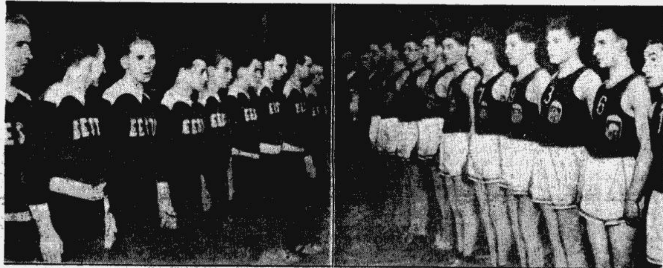
Latvijas un Igaunijas valsts vienības pirms spēles pagājušā gadā Tallinā, kad mūsu vienība atzīmēja 35—33 uzvaru.

dīsies Sporta namā. Tur īseni tikai ar vienu vienīgu nodomu: lai sveiktu uzvarētāju! Mēs izprotam sportu visos dziļumos un tādēļ mūsu cieņību uzvarētāja lomē esot, saņemam kā igauņus, tā arī latvis. Tāpat arī vienlīdzīgi cīņā uzmunšinām abas vienības un beidzot jūsmīgi sumināsim labāko no tām — uzvarētāju! Esam priecīgi, pēc ilgāka pārtraukuma pie sevis atkal redzēt Igaunijas basketbolistus, jo par viņiem un mums Baltijas valstu sporta vēsture stāsta atzinīgus vārdus kā augstvērtīgiem sportistiem, krietniem cīnītājiem, bet arī seniem, sīviem un tomēr dženimēniskiem sacensojiem. Ar interesi gaidot rītdienas ciņu, „Sporta Pasaule” šodien kopā ar ikvienu Latvijas sporta draugu saka: Tervitame omi sōpru — Eesti korvpallimāngijaid! Sveicam savus draugus — Igaunijas basketbolistus Rīgā!