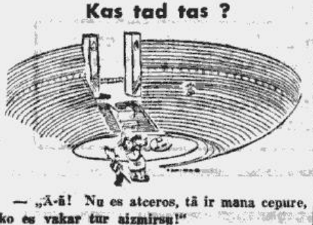
— „A-ā! Nu es atceros, tā ir mana cepure, ko es vakar tur aizmirsi!”