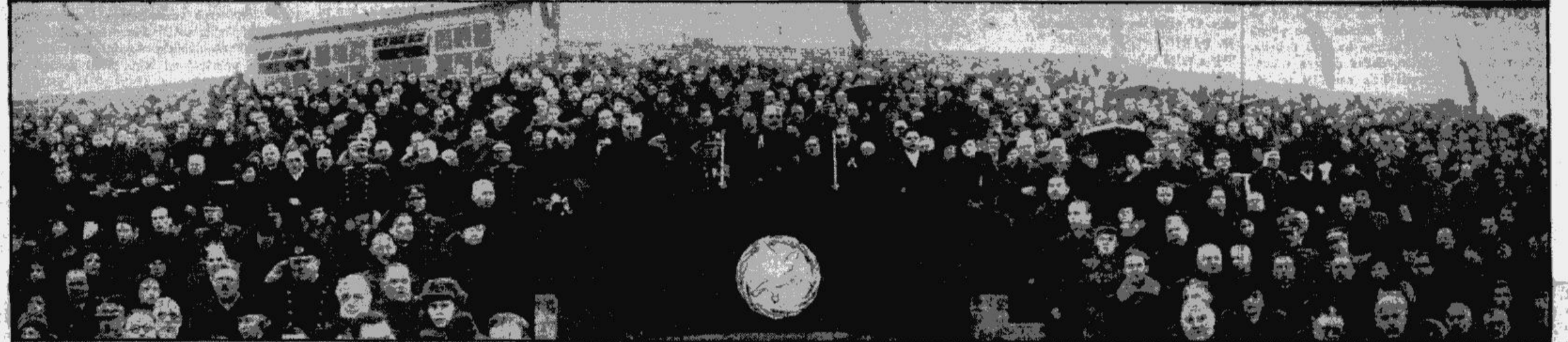
Valsts Prezidents Kārlis Ulmanis, valdības locekļi un skatītāju tūkstoši ar piecilānos godina „Dievs, svētī Latviju!” skanās, kas vēstā 40. Eiropas ātrslidošanas meistarsacīkšu atklāšanu.