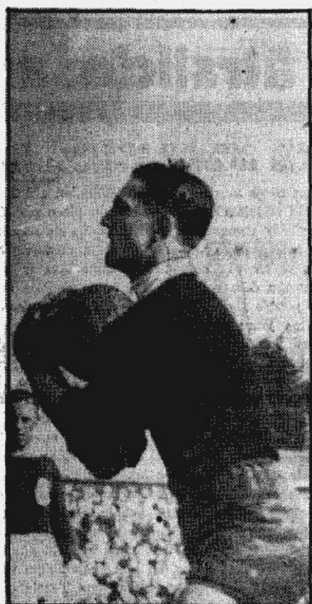
Jānis Bebris (RV) — izcilais Latvijas valsts futbola vienības vārtsargs.

Nākošā svētdienā Zakopanē bija paredzēts noturēt Polijas — Latvijas valsts sacīksti daišslidošanā. Vakār tomēr Rīgā saņēma Polijas ziemas sporta savienības telegrama, kur poļi paziņo, ka pastāvot ļoti sliktiem ledus apstākļiem, viņi spiesti sacīksti atlikt uz nenoteiktu laiku un maz ticams, ka sacensības vairs šai sezonā varēs izvest.