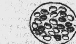
Un vispār: kanadietiņiem ledushokejs ir jau asiņai! Ja mums ir baltie un sarkanie asinsķermeņi, tad kanadietiņiem tai vietā ir baltās un sarkanās ledushokeja ripiņas (lūk — augšējā zīmējumā; palielināti kanadiešu asinsķermeņi...)