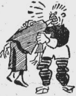
Ja kādam kaunam ir uzvaras Dūms — lai viņš droši tet uz slīdotavu. To kanadieši nenoris...