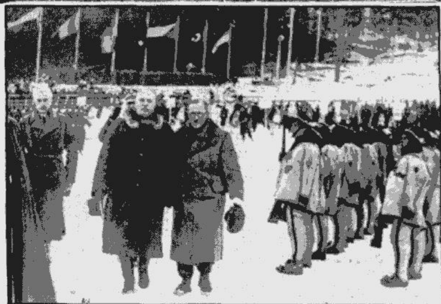
Polijas valsts prezidents Mosckickis ierodas atklāt pasaules meistarsacikstēs slēpošanā Zakopanē. Šis sacensības patlaban saista visas pasaules slēpotāju vislielāko uzmanību un pirmie rezultāti zināmi arī jau „Sporta Pasaules” lasītājiem.