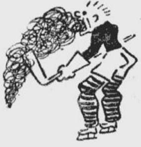
Lūk — pasaules meistarsaukuma The Smoke Eaters (Dūmu rīvēji) loceklis!

Kanada atkal izcīnījusi pasaules meistarsaukumu ledushokejā. Bet... par to vairs neviens nebrīnās! Kanada savā iemīļotajā sporta veidā pasaules meistargodu nes jau 9. reizi. Par kanadiešu ledushokeju kāds ārzemju laikraksts ievieto zemāk pievienoto karikatūru seriju. Kā zināms, Kanadai pasaules meistarsaukumu šogad ieguva The Smoke Eaters (latviski tas ir: „Dūmu rīvēji“) vienība.