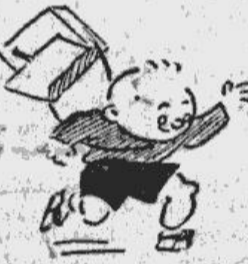
Ar slīdām pie kājām tie dodas uz skolu...