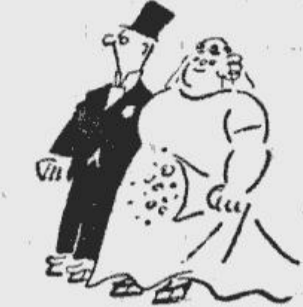
... un uz slīdām stāvēt salaulājus!