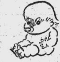
Vai jābrīnās, ka kanadieši ir labākie ledushokejistu pasaulē? Vīpi taču ar slīdām pie kājām jau pasaulē ierodas...