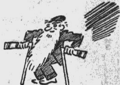
Kad kanadietis kļūst vecs, viņš atspiežas uz ledushokeja rīvējam...