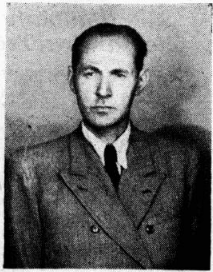
un katrs latviešu padomju muzikas draugs un cienītājs.

Par viņu dziļi skumsti komponisti, konservatorijas mācību spēki, audzēkņi