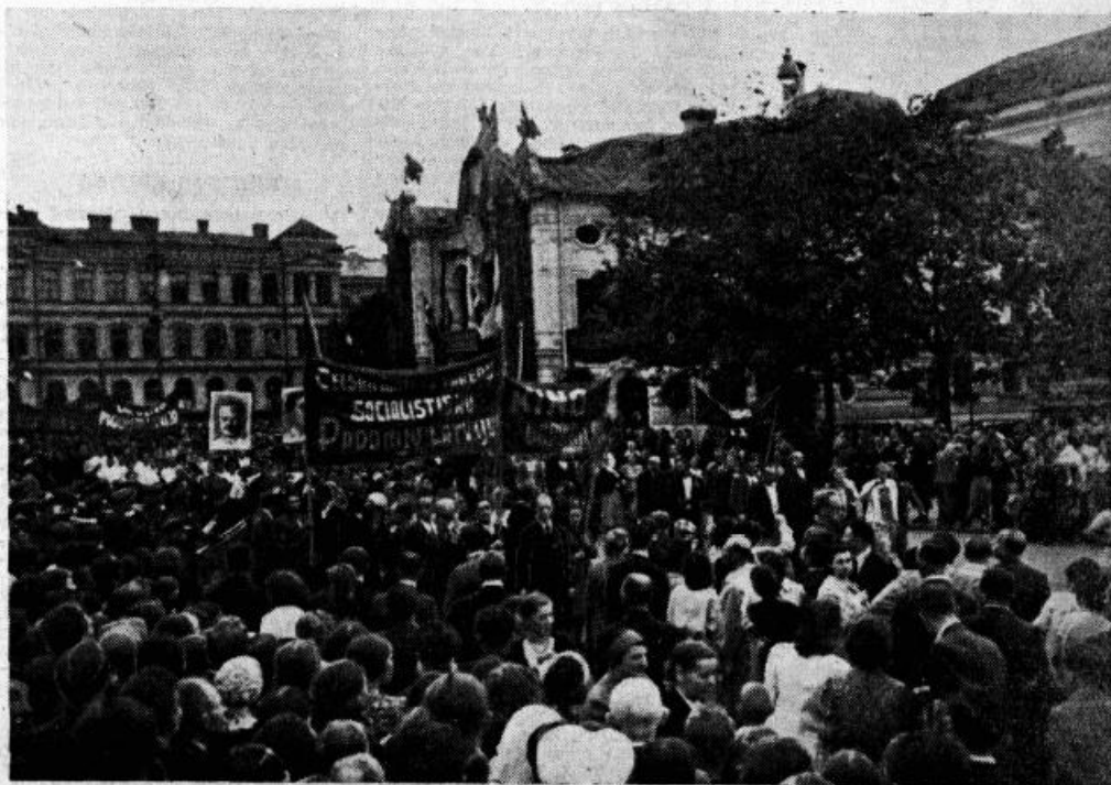
1940. gada 21. jūlijs. Darbaļaudu demonstrācija sveic padomju iekārtas nodibināšanu Latvijā

Padomju Latvijas septītajā gadadienā ideoloģiskās frontes darbinieki var apliecināt, ka viņi kopā ar republikas darbaļaudim bolševīku partijai un lielā Staļina vadībā atdos visus savus spēkus tālākam mūsu republikas dzīves uzplaukumam, cīnīsies par komunisma uzvaru mūsu zemē.