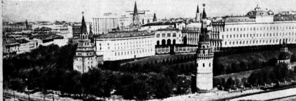
Skats uz Maskavas Kremli

Nav šaubu, ka Dailes teatra panākumi mūsu Dzimtenes galvaspilsētā Maskavā dos jaunu darba sajšumu republikas teatru kolektīviem, ka jaunajā teatra sezonā tie gūs vēl iespaidīgākus sasniegumus, pildot bolševiku partijas un biedra Staļina norādījumus kultūras celtniecības darbā. Tam kļī — līdzinācies sasniegumi un teatra darbinieku kvēlā griba kalpot savai tautai un padomju dzimtenei.