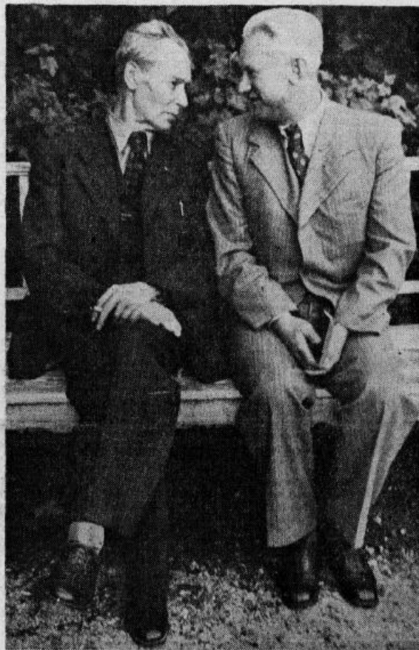
PSRS Padomju rakstnieku savienības ģenerālsēkretārs rakstnieks A. Fadejevs un tautas rakstnieks A. Upiņš Latvijas Padomju rakstnieku II kongresa laikā

Padomju patriotisma tēma tādā veidā izpaužas padomju rakstnieku darbu vairākumā. Bet K. Simonova stāstā šī tēma atrod savu tiešo izteiksmi. Šeit mūsu padomju cilvēks, mūsu padomju dzīve parādīta pretstatā parastā viedējā amerikāņu dzīvei. Stāsta sīkās nav sarezģītas. Padomju pilsonis, kas nostrādājis pāris gadu, — pēdējo kara gadu un gadu pēc kara, — Amerikas Savienotajās Valstīs, atgriezās PSRS. K. Simonovs savā nelielajā stāstā skaidri, spilgti parādā mūsu padomju iekārta priekrocības, salīdzinot tās ar sabiedrību, kurā valda naudas vara, kurā sīkpilsonība ieperinās vāšā dzīvē un kurā valdošās aprindas, izmanojot visas savas iespējamības cilvēka apziņas saundēšanā, lepot cilvēkā, — nemaz jau nerunājot par cilvēku nicināšanas uzskatiem, — tieksmi iekārtot tikai savu personīgo dzīvi, dzīšanos pēc dolāra, kas ir visas buržuāziskās pasaules cilvēku dzīves galvenais regu-