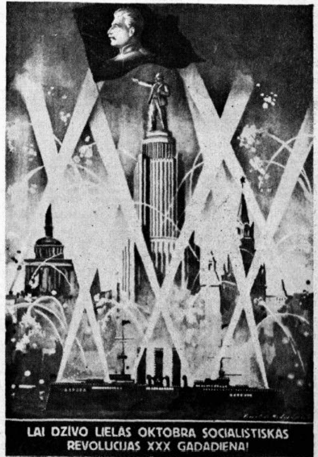
LAI DZĪVO LIELĀS OKTOBRA SOCIALISTISKĀS REVOLUCIJAS XXX GADADIENĀ!

So vēlējumus padara vieglāku draudzība, gatavība palīdzēt, kas raksturo visu padomju tautu pārstāvjus, spērtne no atsaucība, ko izjutām visā savā ceļojumā. Erevanā, Rakstnieku savienī-bā aizkustināti klausījāmies, kā skanēja armeniski Mirdzas Kempes, Valds Luksa un monas dzejas. Tīlīsi Nizami piemiņas vakarā latviešu rakstnieki sēdēja prezidijā, un Georgijs Leonidze teica, ka tīkai Padomju Savienībā ie-spējams tāds vakars, kur gruziņi un latvieši, kuru zemes šķēr tūstoši kilo-metru, godina azerbaidžāniešu dzej-nieka piemiņu. Varavīksne no Baltijas jūras bija nolaidusies Kaukaza kalnos. Dīzēno Oktobra svinību priekšva-karā no jauna domājām par tautu draudzību, kas tik brīnīgi savieno simtiem miljoniem padomju pilsoņu. Lielā Stalīna, komunistiskās partijas, pašu padomju tautu radītāis draudzī-bas likums ikvienam mums ierakstīts prātā un sirdī. Isā laikā esam guvuši ievērojamus, jaunus panākumus, vēl krāšņāka lielās draudzības saulē uz-plauks Padomju Latvija nākotnē.