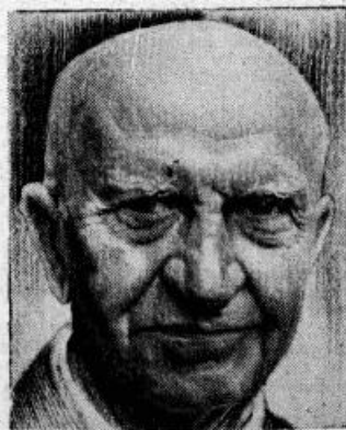
Tautas rakstnieks Ernests Birznieks-Upītis