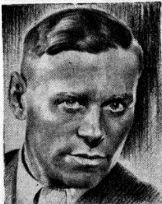
Tautas rakstnieks Vilis Lācis