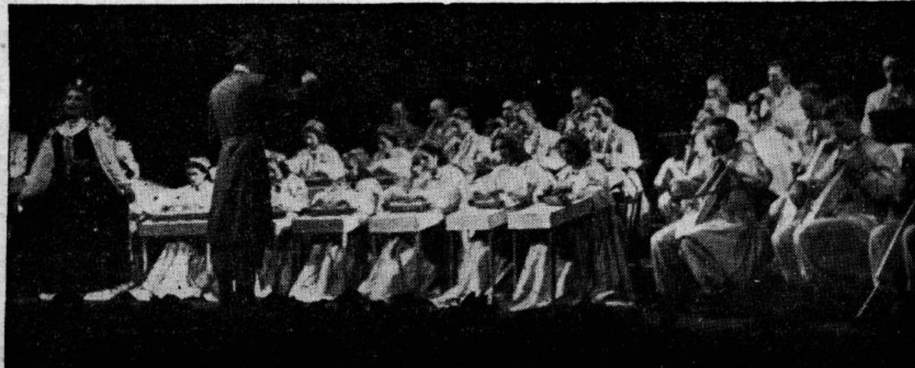
Tautas instrumentu orķestra pirmais koncerts Operas un baleta teātrī š. g. 6. novembrī

«Literatūras un mākslas» š. g. 46. nr. rakstā «Dzīves varonības tematika» ieviesusies iespaidīgāda. Pieminēts mākslinieks Medvedjevs, jābūt — Matvejevs.