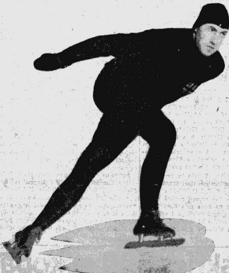
Ivars Balangruds (Norveģija) — 1938. gada pasaules meistars ātrslidošanā un viens no drošākajiem uzvaras favorītiem arī šogad Helsinkos.