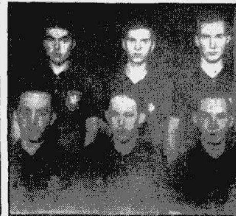
Latvijas galda tenisa vienība

Lodzā, 5. martā. Latvijas valsts galda tenisa vienību ierodoties Lodzā, sagaidīja poļu pārstāvji. Mūsu sportistus un abus pārstāvjus novietoja vienā no labākām pilsētas viesnīcām — Polonia. Jau iepriekš vērtētie laikraksti bija ievietojusi garus prologus ar vairākiem uzņēmumiem par mūsu vienību. „Glos Porann” bija ievietojusi pat dažas mūsu spēlētāju karikatūras. Sacīkste notika uz pilsētas teātra skatuves — gan jāteic, diezgan nepierastos apstākļos. Cīņas rīsinājās uz mikstiem paklājiem un galdu apgaismoja projektori. Klāc bija apm. 1000 skatītāju un vairāki goda viesi. Starp tiem bija arī Polijas kara ministra pārstāvis gen. Tohmē, un kara sporta priekšnieks pulkv. Kureks. Kā jau zināms, spēli latvju vienība zaudēja ar 4—5 rezultātu. Labākais poļu galda tenists — Šiffs, pieveica it visas Latvijas reprezentantus. Katrs poļu spēlētājs bija no atveis-