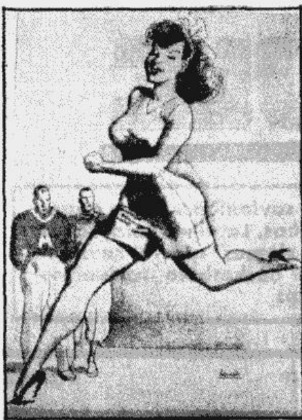
Vīpa ir vienmēr formā...

Bet sporta jaunatne paliek ik gadus arī garīgi pilnvērtīgāka. Labi sportisti ir arī cilvēki ar augstu intelektu. Pamazām atīstas tas sportista tips, kam sena atblāzma vēl ir no Atēnu laikiem — fiziķi un garīgi pilnvērtīgi, ar gaišu smaļdu un tīrām domām. Tā sports pārāudzina tautu, kā liels skolotājs radot jaunu, varonīgu paaudzi, kuras rindās līdzi melnā darba strādniekam uzskata par godu solot teologs un profesors, bet visus vieno