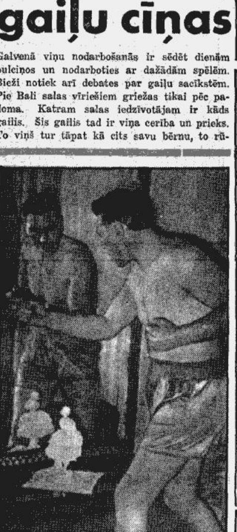
PJERS SARLS (BĒLĢIJA).

Katrai tautai un zemei ir savas īpatnējas parašas un savādības. Ar šīm īpatnībām tās atšķiras lielā mērā viena no otras. Tāpat tām ir savas iemīļotas spēles un sacīkstes. Tā Anglija slavena ar boksu; Somija ar saviem teicamiem skrējējiem; Norvēģija ar ātrslidoņiem, bet Spānija ir populāra ar vēršu cīņām. Par šīm vēršu cīņām ļoti jūsmo visa spēļu tauta. Uz tām iet visi: gan veci, gan jauni, gan bagāti un nabagi. Lai kļūtu skaidrāks skats par šo spēļu izpici, jāsaka, ka tā viņiem ir tas pats, kas mūsu lauku iedzīvotājiem zaļumballes un pilsētniekiem kino. Daudzreiz Spānijā ir bijuši gadījumi, ka iedzīvotāji nezin, kāds ministru prezidents valda Madridē, bet toties droši paaaka viņu ievērojamāko toreadoru vārdus un cik katrs no tiem vēršus nonāvējis. Toreadori savu amatu mācas jau no zēna dienām. Daudzi toreadori ir šā laikā kļuvuši miljonāri, bet tikai retais mīrēt dabīgā nāvē. Pat lielākais spēļu toreadors, kas savā mūžā ir veicis vairākus simtus vēršu, bieži krīt par upuri līdz ārpriētam saņiknotajām dzīvniekam. Spāņi vēršu cīņām seko ar mums ziemeļniekiem grūti saprotamu interesi. Šīs cīņas nav drēkstējusi aizliegt neviena Spānijas valdība, jo šādām rīkojumam neapšaubami sekotu plaši nomieri. Vēršu spēles ir spēļu tautas nacionālās īpatnības vispilgtākais izpaudums. Tagad gan iekšējā pilsoņu kara dēļ vēršu cīņas ir itkā pārtrauktas, bet nav šaubu, ka karām izbeidzoties, tās uzliesmos ar tādu pat sajūsmu un enerģiju kā agrāk.