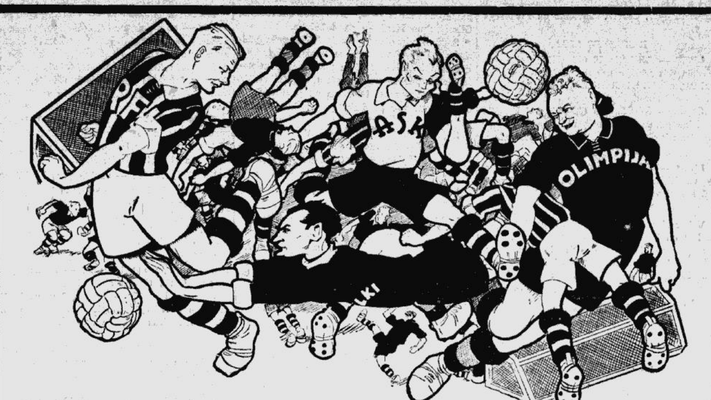
Futbola karnevals ir sacies! Zibesturnīrs vakar oficiāli atklāja 1939. gada sezonu. Zīmējumā redzam mākslinieka Civis'a veidoto jau tro futbolistu pulku (tur jūs droši vien saskatīsiet arī savas pazīņas — RFK Raisteru, ASK Pētersonu, RV Bebrī, Olimpijas Laumani u. t. l.) sezonas sākumā. Veiksmīgas nākošās cīņas!

Jūrmalas Sporta — Ilģeciema cīņā. Parastās 2x10 minūtes noslēdzās 0-0 neizšķirti. Arī 11 m soda sitieni izpildīšanā pretinieku piemeklēja pilnīgi vienāda veiksmē. Katra puse ievēja 2 vienpadsmitniekus. Uzvarētāju nācās noskaidrot lozējot. Laimests un uzva-