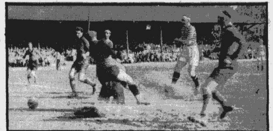
Viens no daudzajiem interesantiem momentiem, kādi bija redzami vakardienas opernieku un drammas aktieru futbola sacīkstē.