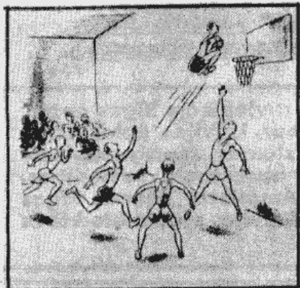
— Hallo, hallo! Grozā jāmet vienīgi bumba!

sacīkstes laikā, kura bija pirms lielās mūsu zēnu cīņas, „saborojās“ un apstājās lielās zāles laika rēķināmajā pulksteņa, tā ka dramatiskās Latvijas — Lietuvas cīņas cīnītājiem nebija iespējas sekot sacīkstes ilgumam, kaut arī tam izšķirošas cīņas momentos var būt liela nozīme. Vēlāk arī kāds vietējais latvietis aizrādīja uz minēto tehniķa trūkumu, sakot: „Redzēsiet — turpmākās dienas pulksteņš ies kā zirgls!“ Un tiešām, patreiz pulksteņš strādā nevainojami!!!